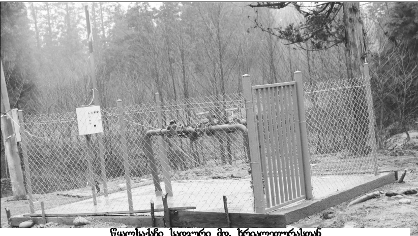
წყალსატენი სადგური მდ. ხრიალეთურასთან