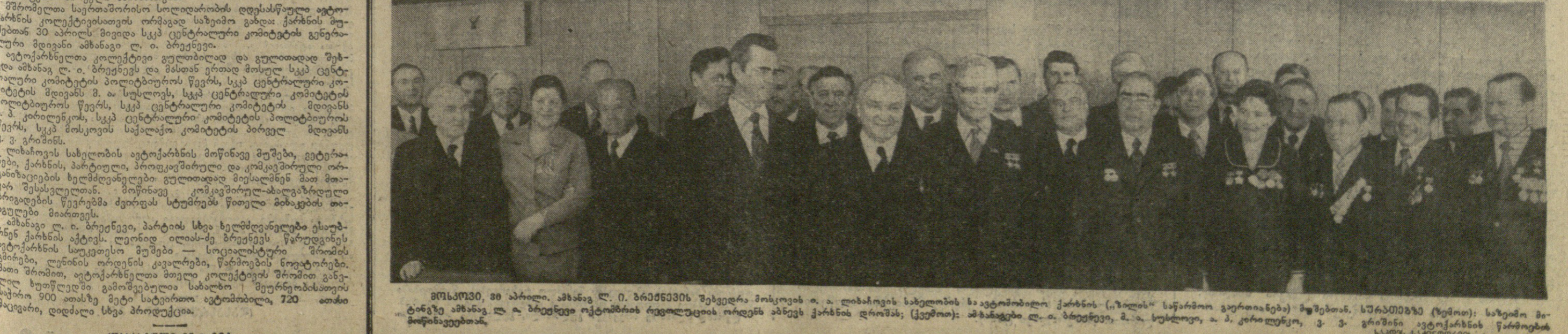
მოსამსახურე, 80 აპრილი. ახანა ლ. ბრეჟნევი, მ. ს. გორბაჩოვი, სსრკ-ის მინისტრთა საბჭოს წევრები...