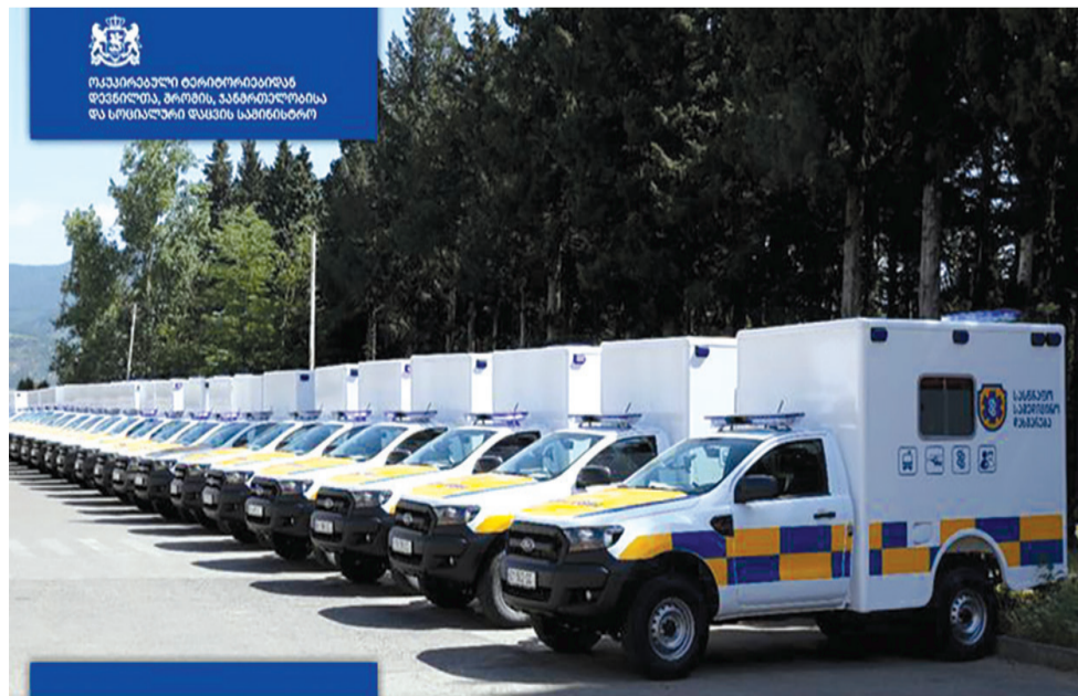
სასწრაფო სამედიცინო დახმარების ავტოპარკი სპეცმანქანებით განახლდა

სასწრაფო დახმარების 23 ახალი ავტომობილი ქვეყნის მასშტაბით, რეგიონებში, მათ შორის სამურის მუნიციპალიტეტში გადანაწილდება.