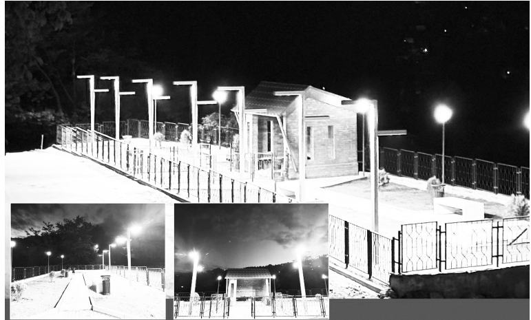
გვერდი მოამზადა ოთარ ცინაიძემ

პროექტის ღირებულებამ 188 189 ლარი შეადგინა. სამუშაოები ხულოს მერიის დაკვეთით, კონტრაქტორმა კომპანია „მშენებელი-5“ შეასრულა.