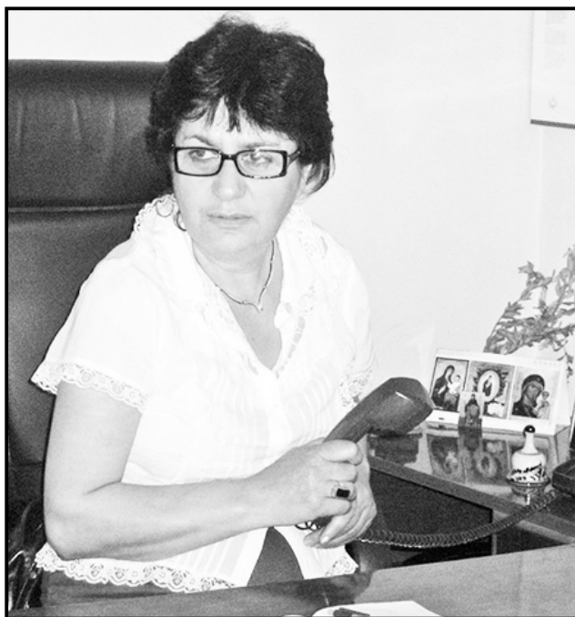
მოდელი ოჯახის, ახლობლების, მეგობრებისა და სამშობ- ლოს წინაშე.

ახლა ჩვენს მეგობარზე წარსულში ვსაუბრობთ, დასაწა- ნია, დიდი დანაკლისა, ამასთან, ბედნიერებაა, გაიხსენო მისი ღვაწლი და გულდაჩერებით თქვა - იმქვეყნიურ სასუფეველ- ში მიემართება ღირსეული ქართველი ქალბატონი, ვალ-