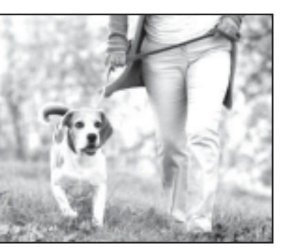
აღნიშნული ქმედება გამოიწვევს პირუტყვის მესაკუთრის დაჯარიმებას 50 ლარის ოდენობით, ხოლო ბულვარში, პარკში, სკვერში პლაჟზე ან წვრილფეხა ან/და მსხვილფეხა პირუტყვის მესაკუთრის დაჯარიმებას 100 ლარის ოდენობით.

პარლამენტმა „ადმინისტრაციულ სამართალდარღვევათა კოდექსში“ ცვლილებას პირველი მოსმენით, 80 ხმით მხარი დაუჭირა. ცვლილება ადმინისტრაციული პასუხისმგებლობის გამკაცრებას ითვალისწინებს იმ შემთხვევებისთვის, რომლებიც ძალის ღია სივრცეებში, მათ შორის, ბულვარში, პარკში და სკვერში გასეირნების წესებს დაარღვევენ.