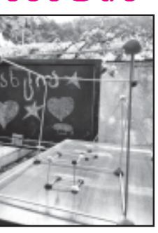
„მანტია“-ს თავისუფალი დროით ისარგებლეს მოქალაქეებმა და 9 საათიდან 14 საათამდე ადგილზე გაეცნენ ჩვენს სასწავლო პროგრამებს. 14:00-დან 16:00 საათამდე მიმდინარეობდა კრიტიკული აზროვნების განვითარება: ქართული ენა და ლიტერატურა, მათემატიკა.

შემეცნებითა ცენტრმა მანტიამ 1 ივნისს, ბავშვთა დაცვის საერთაშორისო დღესთან დაკავშირებით 9 საათიდან საღამოს 7 საათამდე საზოგადოებას მრავალფეროვანი კონტრული აქტივობები შესთავაზა.