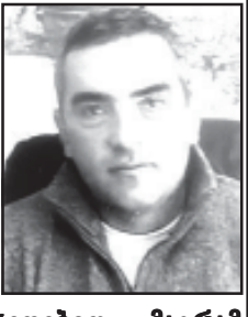
დედა, და ოჯახი

ჩვენი დათო რვა ივნისს 51 წლის გახდებოდა, მეცამეტე წელია რაც უშენოდ ვხედებით ივნისის ამ ღამეს დღეს. მიუხედავად ყველაფრისა ჩვენთვის, შენი ახლობლებისთვის, ოჯახის წევრებისთვის, მეგობრებისთვის, ყველასთვის, ვისაც უყვარდი ეს დღე მუდამ შენი მოგონებით სავსე იქნება.