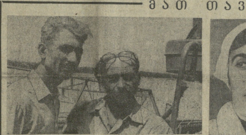
ყანაბილან, კლავიაბილან — საბჭოთაო გელაბი.

კომემურეები, საბჭოთა მემორიალების მემორიალი, მემორიალი კრები წარმატებით იბეღეს მარცვლეულის, ჩანის, სადრეო კარტოფილისა და სხვა კულტურების მოსავალს.