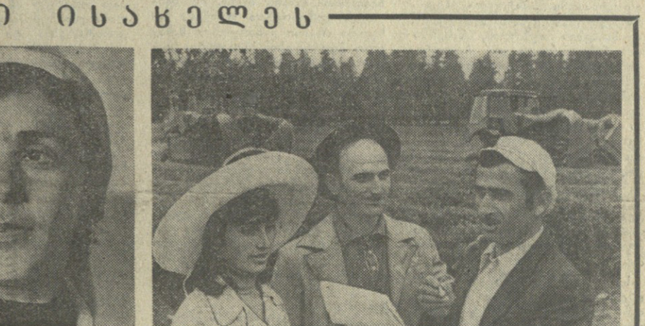
ყანაბილან, კლავიაბილან — საბჭოთაო გელაბი.