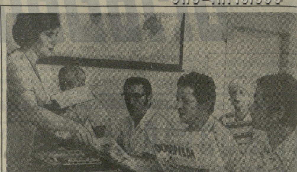
სულ უმრავლეს შემთხვევაში გერმანიის დემოკრატიული რესპუბლიკის მასშტაბურმა საბავშვო ოჯახებმა...