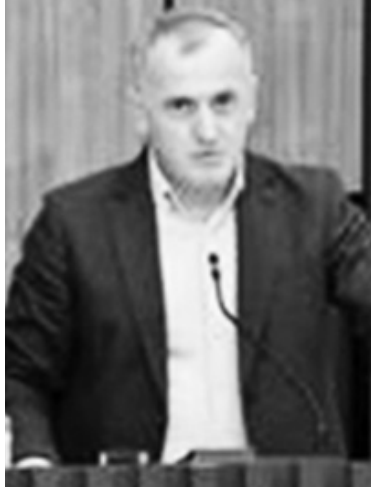
შინარსობრივი, ისე ტექნიკური მიმართულებით. მრჩეველთა საბჭო

უმადღესი საბჭოს რიგგარეშე სხდომაზე კანონმდებლებმა მოისმინეს და ცნობად მიიღეს საზოგადოებრივი მაუწყებლის აჭარის ტელევიზიისა და რადიოს მრჩეველთა საბჭოს 2022 წლის საქმიანობის ანგარიში