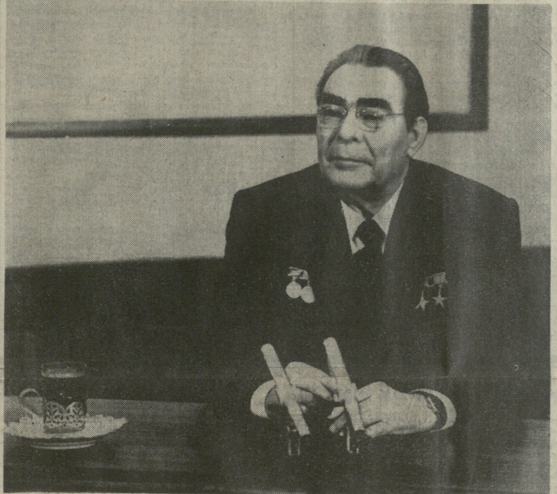
საკვ ცენტრალური კომიტეტის გენერალური მდიანი...