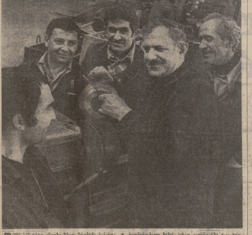
ლირი სსრკ-ში ერთიანი შრომის საქართველოს ყრილობის შემდეგ. მარჯვნივ: სსრკ-ის პრემიერ-მინისტრი ლეონიდ ბრეჟნევი, საქართველოს პრემიერ-მინისტრი ივანე ჯავახიშვილი, სსრკ-ის პრემიერ-მინისტრის მოადგილე ნიკოლაი სიგოი, საქართველოს პრემიერ-მინისტრის მოადგილე ვახტანგ კახიანიანი.