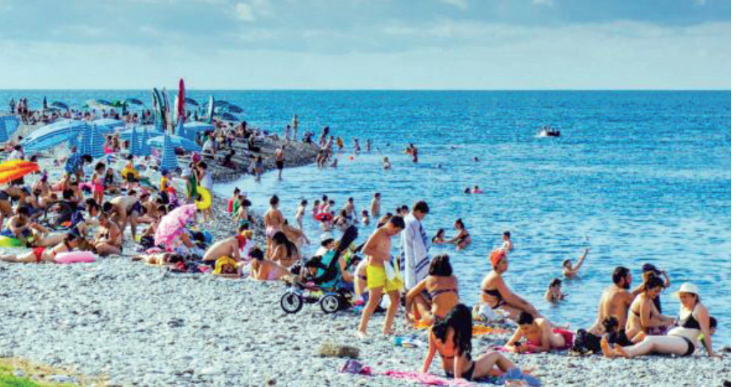
კვლევები ტარდება შემდეგ მონაკვეთებში: ნაწლავის ჩხირის ჯგუფის ბაქტერიები, ლაქტოზა დადებითი ნაწლავის ჩხირები, ენტეროკოკი, კოლიფაგები, სალმონელას ბაქტერიები. სინჯების აღება ხდება მცურავი საშუალების გამოყენებით ნაპირიდან 50 მეტრის რადიუსში.

გარემოს დაცვისა და ბუნებრივი რესურსების სამმართველო ზღვის წყლის ხარისხობრივ მონიტორინგზე, მონიტორინგის პროგრამის ფარგლებში, სარფი-ჩოლოქის მონაკვეთზე 7 წერტილში (ბათუმის ცენტრალური პლაჟი, აკვამარჯის მიმდებარე ტერიტორია, კვარიათი, სარფი, ქობულეთის ცენტრალური პლაჟი, ბობოყვათის მიმდებარე ტერიტორია და მწვანე კონცხი) ზღვის წყლის ბაქტერიოლოგიური კვლევები ჩატარდა. ინფორმაციას აჭარის მთავრობის პრესსამსახური ავრცელებს. მათი ცნობით, ჩატარებული ლაბორატორიული კვლევების მიხედვით, ზღვის წყლის ხარისხი მთელ პერიოდში, 7-ვე წერტილში დასაშვები ნორმის ფარგლებშია და იგი უარსაღიძურე მონიტორინგით შედარებით გაუმჯობესებულია. მიმდინარე წელსაც, როგორც ყოველთვის, ყველაზე უკეთესი მონიტორინგის დაფიქსირდა სარფი-კვარიათისა და მახინჯაური-მწვანე კონცხის ტერიტორიაზე, დადებითი მონიტორინგები დანარჩენ წერტილებშიც.