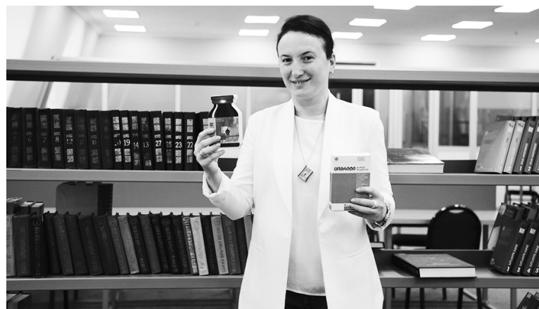
- ცხოვრება მშვენიერია. - ცხოვრება გაიძულვს... - დაიცვა წესები მის სათამაშოდ. - როგორ ბათუმში ისურვებდით ცხოვრებას? - სადაც ყველას ერთმანეთი უყვარს და პატივს სცემს.