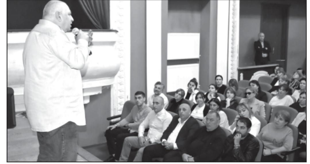
არბოლიშვილი, საკრებულოს თავმჯდომარის მოადგილე ნეკოლოზ კვიციანი, მერის მოადგილე გიორგი ტაბატაძე, ადგილობრივი ხელისუფლების, არასამთავრობო ორგანიზაციების, საგანმანათლებლო დაწესებულების წარმომადგენლები ესწრებოდნენ.

აღნიშნულ საჯარო ლექციას ბორჯომის მუნიციპალიტეტის საკრებულოს თავმჯდომარე დავით ზალიშვილი, მერი ოთარ არბოლიშვილი, საკრებულოს თავმჯდომარის მოადგილე ნეკოლოზ კვიციანი, მერის მოადგილე გიორგი ტაბატაძე, ადგილობრივი ხელისუფლების, არასამთავრობო ორგანიზაციების, საგანმანათლებლო დაწესებულების წარმომადგენლები ესწრებოდნენ.