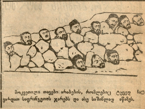
მოკვეთილი თავები არაბების, რომლებიც ტყვედ ჩაუვარდათ საფრანგეთის ჯარებს და ასე საშინლად აწამეს.

მიტინგ-დემონსტრაციაზე დაესწრო ხუთი ათას კაცზე მეტი.