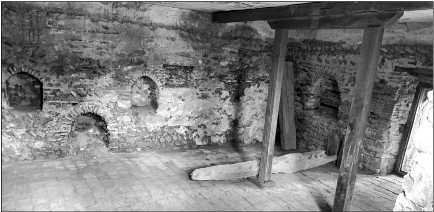
სახლ-მუზეუმის დარბაზი (ქართლური ტიპის)

დანიელ ჭონქაძე 1860 წლის 16 ივნისს გარდაიცვალა. ანდერძის თანახმად, დაკრძალეს მეუღლის გვერდით, თბილისში, მაშინდელი ვერის სასაფლაოზე (ახლანდელი ვერის ბაღი). აღსანიშნავია, რომ ორივე საფლავი იქ დღემდე დაცულია.