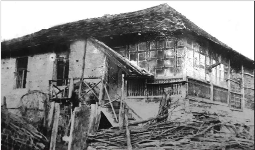
ასეთი იყო მწერლის სახლი სოფელ ყვავილში