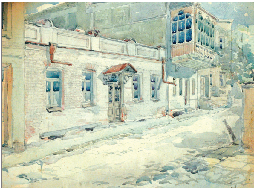
სახლი ანჩისხატის უბანში, სადაც ცხოვრობდა დანიელი (მხატვარი ვ. ჯაფარიძე)

ზრუნავს მოსწავლეთა განათლებისთვის, მათთვის საჭირო სახელმძღვანელოების შოვნასა თუ თარგმნაზე. სემინარიის ხელმძღვანელობის მიმართ ვხვდებით არაერთ პატაკსა თუ თხოვნას, რომლითაც ვიგებთ, თუ როგორ წუხს დანიელი საჭირო სახელმძღვანელოს უქონლობის გამო. სწორედ ეს გარემოება განაპირობებს იმას, რომ იგი თავად იწყებს მოძიებასა და თარგმნას საჭირო წიგნებისას.