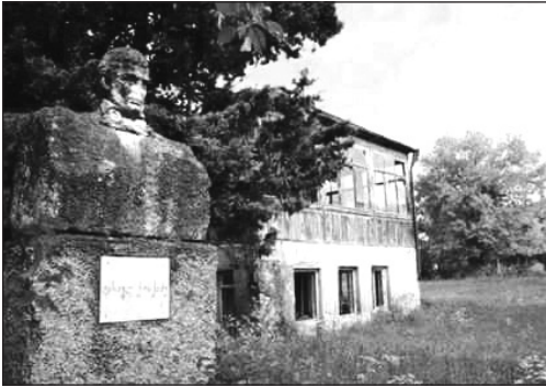
სახლ-მუზეუმი მშობლიურ სოფელში

და აი, უკვე 163 წელი გვაშორებს მწერალს... ვფიქრობთ, საუკუნე-ნახევარზე მეტი საკმარისია საიმისოდ, თამამად ითქვას: მწერალმა გაუძლო დროს.