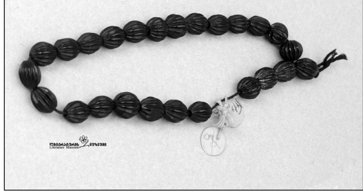
დანიელის ნაქონი ვერცხლის სურა და კრიალოსანი

უკანასკნელ მოდაზე, შესული იყო მაღალ საზოგადოებაში და არაფერს არ იკლებდა. გარდა ამისა, მას ჰყავდა შემძლებელი ნათესავები, რომელნიც სულსაც არ დაიშურებდნენ მისთვის, რადგანაც მეტად სიმპათიური ხასიათის ქართველი იყო. იგი უდროოდ გარდაიცვალა არა სიღარიბისგან, რომელიც მას არც კი მოსიზმრებია, არამედ სიჭლექისაგან, რომელიც იყო შედეგი მისი ჭლექური აგებულებისა. მან, როგორც მახსოვს, დასწერა მხოლოდ ერთად-ერთი მოთხრობა „სურამის ციხე“ - მეტად სიმპატიურს თემაზე, რომელიც თუმცა მოკლებულია ნამდვილს ხელოვნურს ღირსებასა, მაგრამ იპყრობს გაბედულს პროტესტს ბატონყმობის წინააღმდეგ, რასაც ყოველი ქართველი დემოკრატი დიდ ღვაწლად რაცხს“ („ორიოდე სიტყვა დანიელ ჭონქაძეზე და ეგნატე ნინოშვილზე“, 1904წ.).