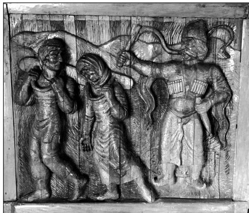
კევრში შებმული დედა-შვილი (კვეთა ხეზე. ბიძინა ჯანუყაშვილის ნამუშევარი)