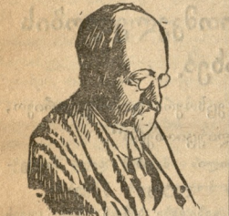
მართლაც—განაცხადა ჩინურინმა—საინა და საერთაშორისო პოლიტიკა იმდენად...