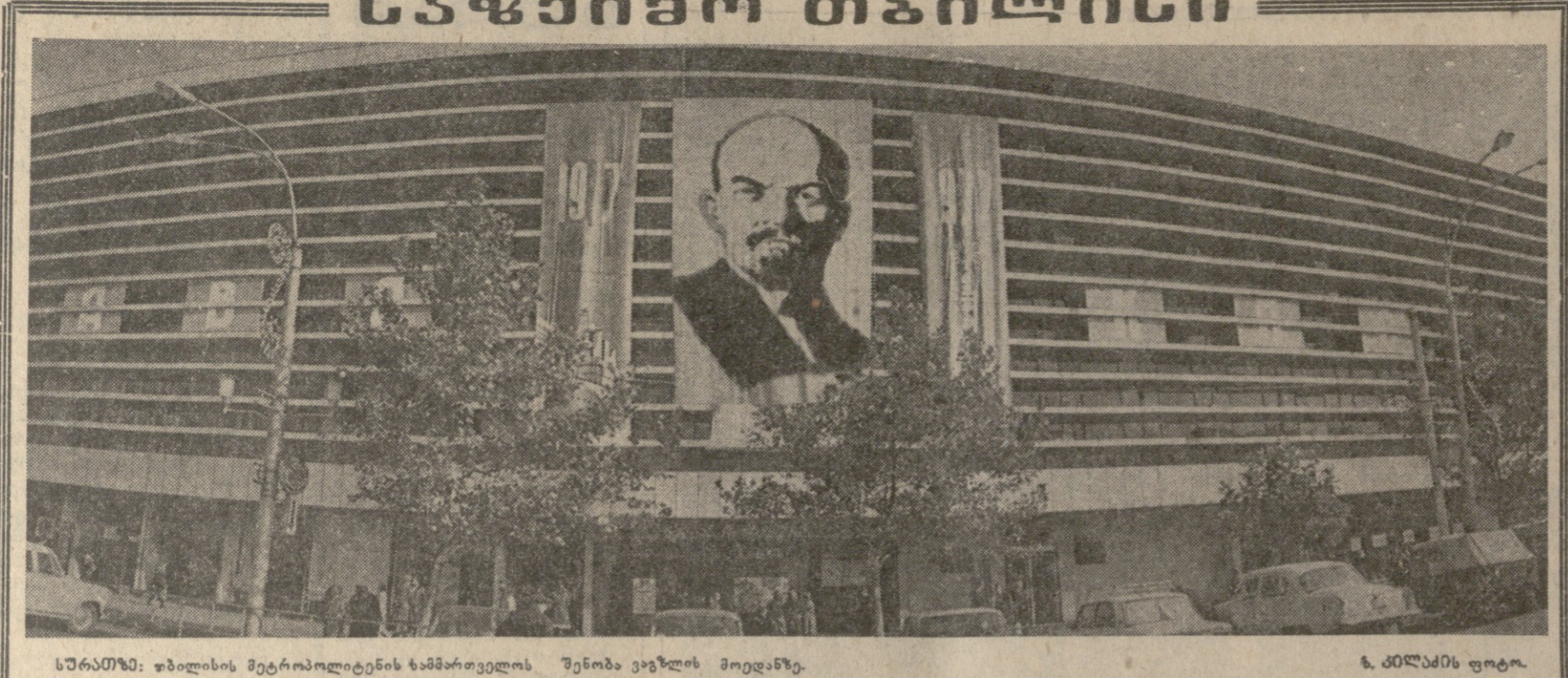
სურათი: ზობინის მერობის დროს გამართული შეხვედრა