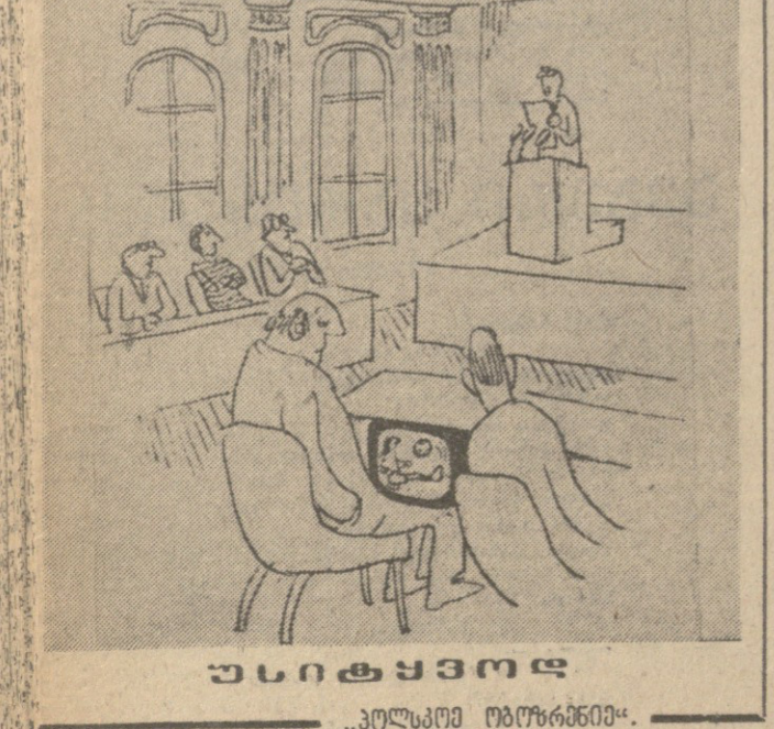
უხსოვრი იუმორი... უხსოვრი იუმორი... უხსოვრი იუმორი...