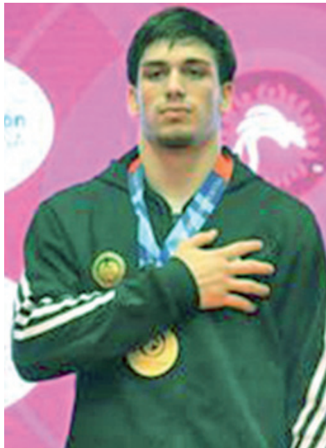
წარმატებაში შეტანილი წვლილისთვის. ვულოცავთ აჩიკოს ევროპის ჩემპიონის ტიტულს და ახალ გამარჯვებებს ვუსურვებთ მას.

სპორტსმენმა მადლობა გადაუხადა საქართველოს ნაკრების მწვრთნელს, აჭარისა და საქართველოს ჭიდაობის ფედერაციებს ამ