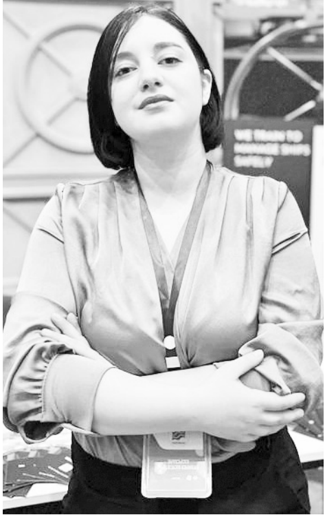
ვაიზარდო, გამოიყენო გარემოება უკეთესი სამუშაო პირობების შესაქმნელად და გქონდეს სუფთა და წრფელი მიდგომა როგორც სამსახურის, ასევე თანამშრომლებისადმი.

- ყველაზე გამოირჩეული შარშან საქართველოსა და იაპონიის შორის ურთიერთობისადმი მიძღვნილი საზემო ღონისძიება იყო... გვესწრებოდა იაპონიის ელჩი თავისი დელე-