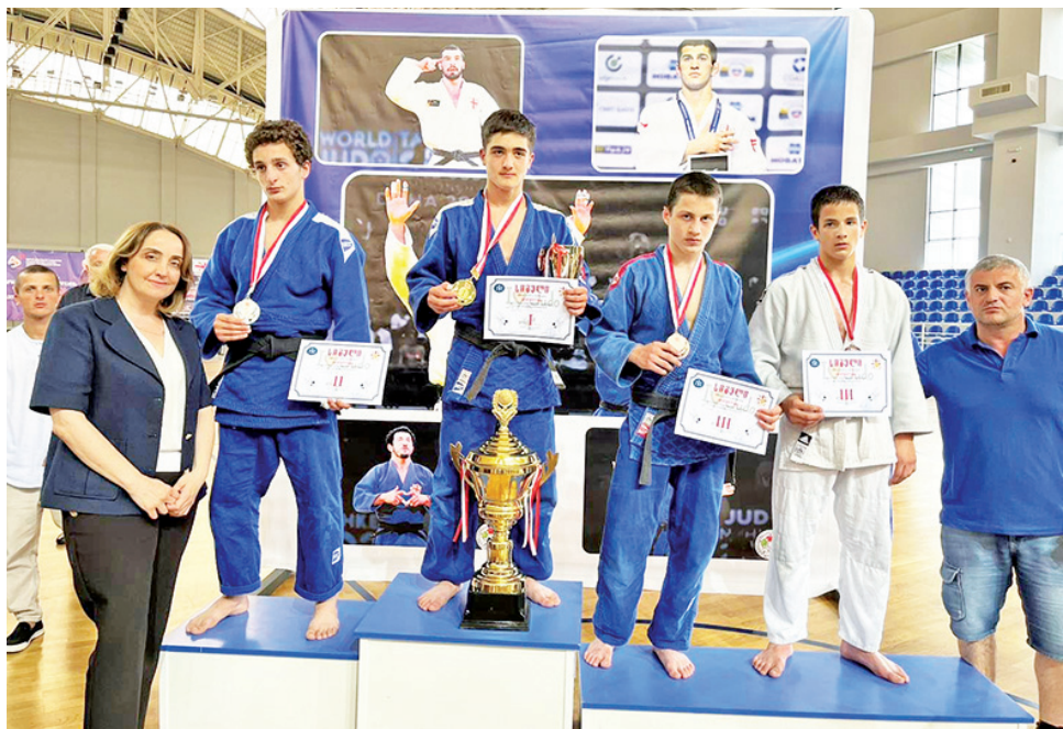
მენები ორგანიზატორებმა თასებით, მედლებითა და სიგელებით დაჯილდოვეს.

შეჯიბრების მთავარი მსაჯის გიორგი ზერეიანის თქმით, ტურნირი, რომელიც კარგად იყო ორგანიზებული, ძალიან მაღალ დონეზე ჩატარდა, რაც ხელს შეუწყობს სპორტის ამ