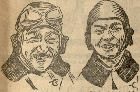
მჭირნაშვილი აბა და კავაშირი-გალაფრანის მომადრი-მინი