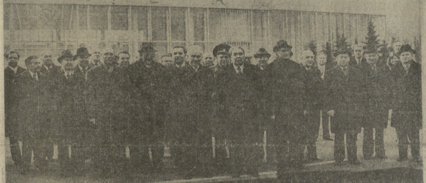
მოსკოვი. აეროდრომზე გაემგზავრა ლ. ი. ბრეჟნევი.

გამცემელთა შორის იყვნენ ბერძანის ფელაქსიული რესპუბლიკის დროებითი საქმეთა რწმუნებულის სსრ კავშირში გ. ბერენდოვი, ბერძანის ფელაქსიული რესპუბლიკის საელჩოს დირექტორი თანამშრომელი (საელჩო).