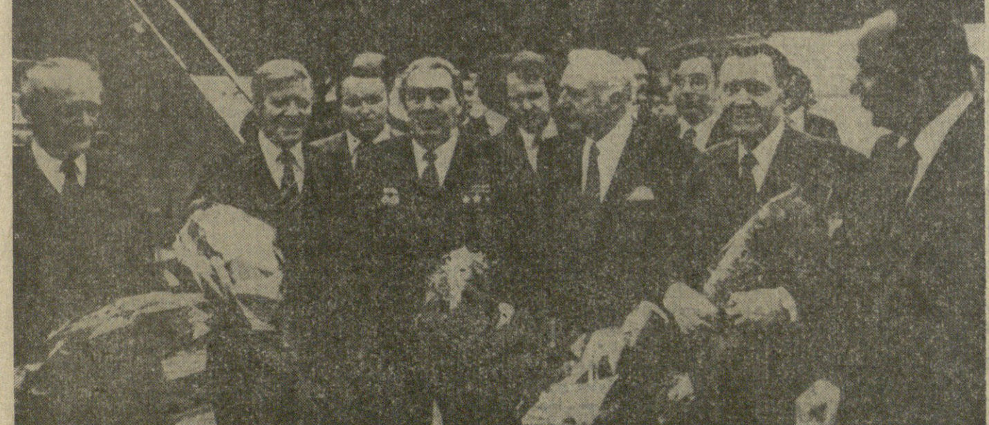
ბრეჟნევი, 4 მაისი. (საქმედის სპეც. კორ.) დღეს ბერძანის ფელაქსიული რესპუბლიკის პრეზიდიუმის თავმჯდომარის ვ. შევლისა და ფელაქსიული კანცლერის პ. შმიდტის მიწვევით ჩავიდა ბერძანის ფელაქსიულ რესპუბლიკაში.

შეგვიძლია საუბრობო კერძო მინია დამთავრდა. ლ. ი. ბრეჟნევი და ვ. შევლისი მინია ჩასდინდნენ. მანქანა მიტოვებისთანავე კორტეჟი გაემართა ბონის მახლობლად მდებარე გინების ციხე-დარბაზისკენ — რეზიდენციისკენ, რომელიც ბერძანის ფელაქსიული რესპუბლიკის უმაღლესი საბჭოს სტუმრებს გამოუყვებ.