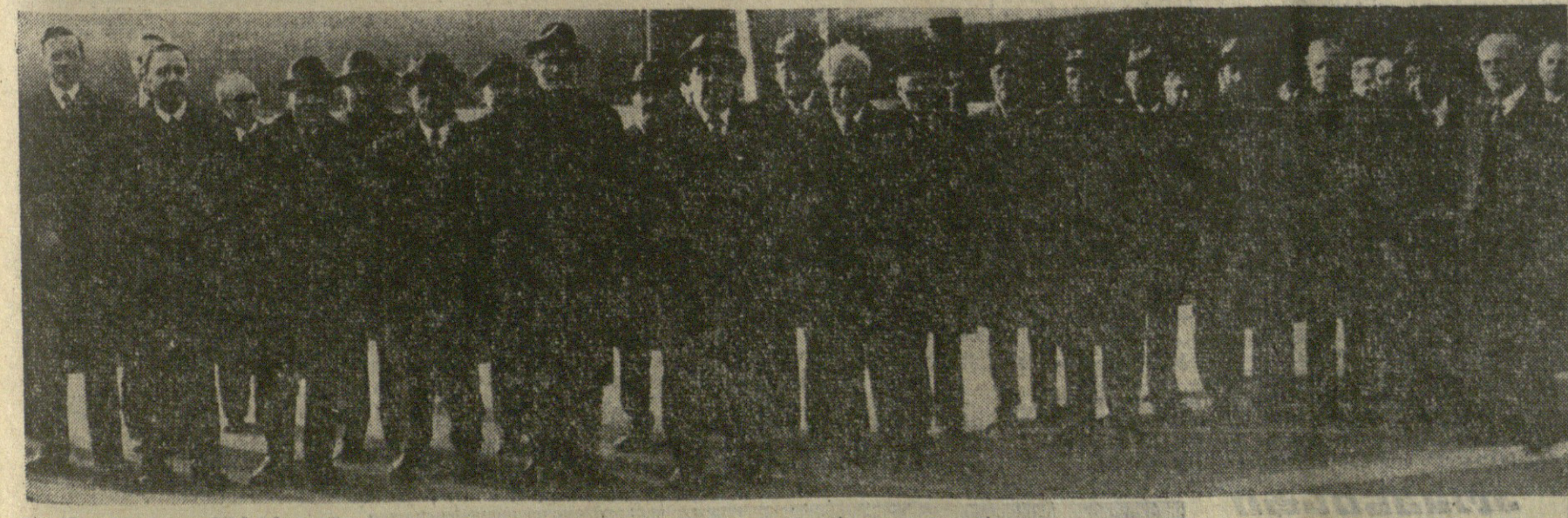
სსრ კავშირის თავდაცვის მინისტრი, საბჭოთა კავშირის მარშალი ლ. ბრეჟნევი.

1978 წლის 9 მაისი № 115 ქალაქი მოსკოვი ამხანაგი გარსაკეცი და მარტოებო, სერგანტებო და ჯარისკაცებო! ამხანაგი ოფიცრებო, გენერლებო და აღმირალებო! ამხანაგი გარსაკეცი და მარტოებო, სერგანტებო და ჯარისკაცებო! ამხანაგი ოფიცრებო, გენერლებო და აღმირალებო!