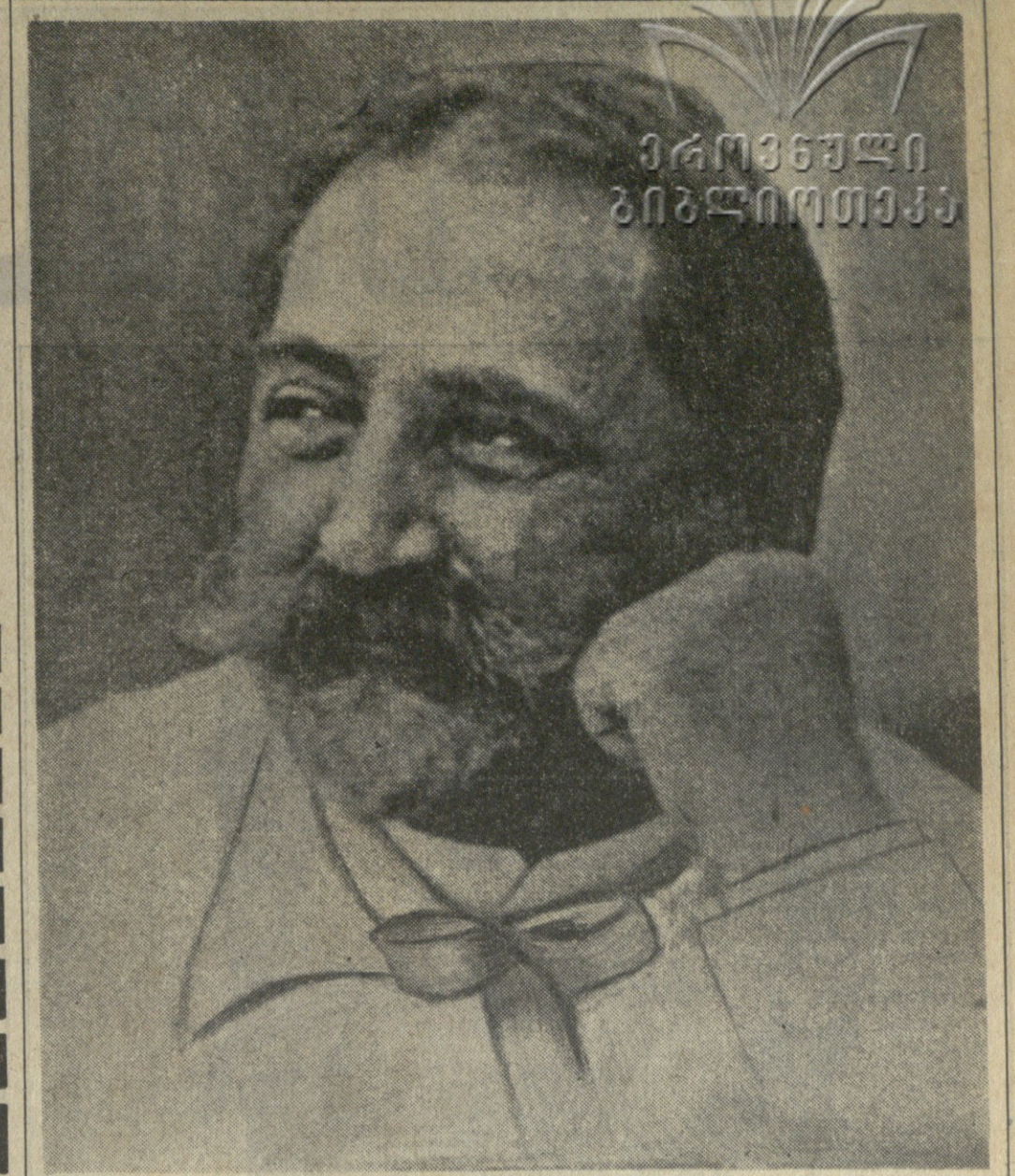
მარად და ველებან, საქართველო, მე ვარ შენთან!