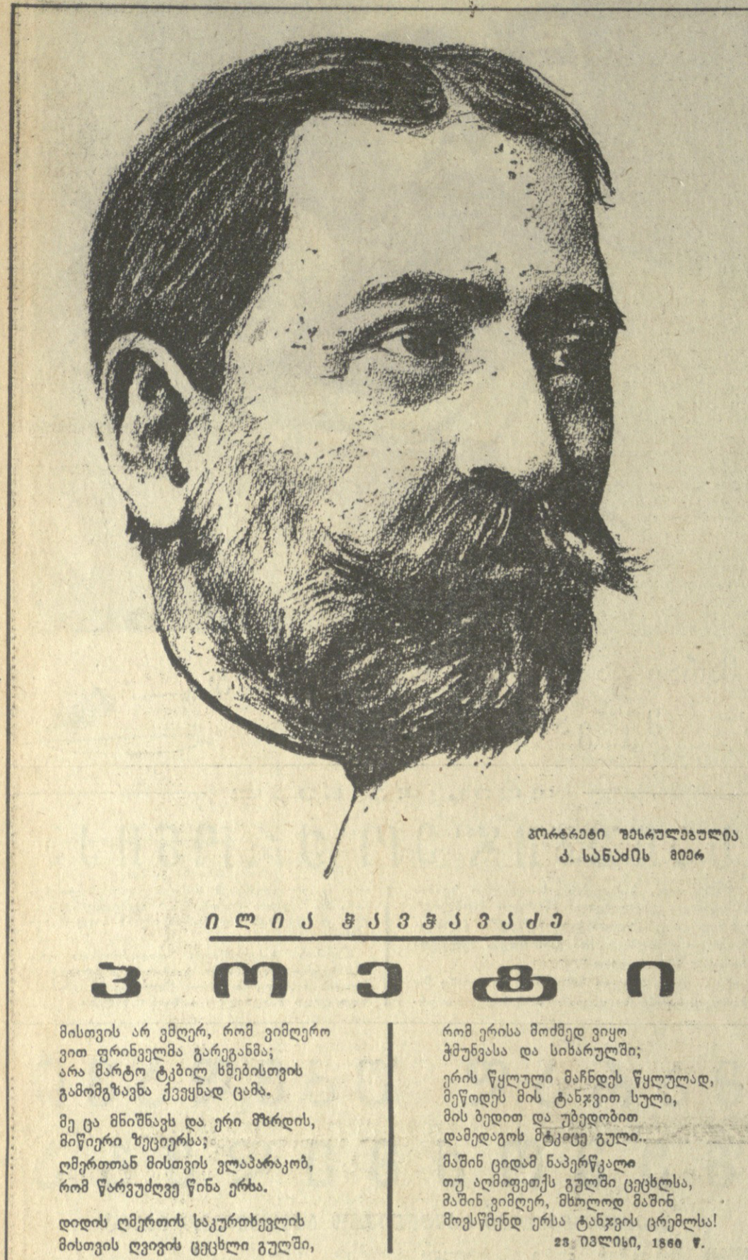
პორტრეტი ილია ჭავჭავაძისა კ. სანაძის 8094

კომუნისტური მემორიალი მისთვის არ ვმდურ, რომ ვიმდერო ვით ფრინველი გარეგანმა; არა მარტო ტყეში სმობისთვის გათმობას ვქვეყნად ცაზე. მეცა მინიშნა და ვერი მზრდის, მიწური წვეთი იმისთვის; ღმერთთან მისთვის ვლაპარაკობ, რომ წარვეტლე წინა ვერსა. დღის ღმერთის საკურთხევლის მისთვის ღვივის ცეცხლი გულში,