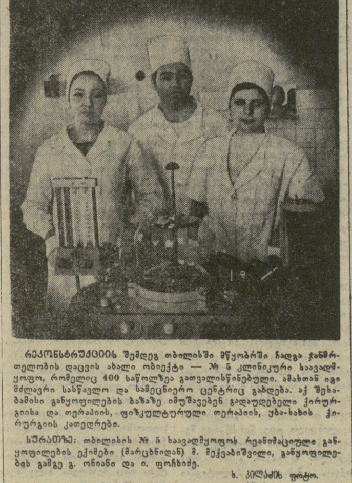
რამდენიმე წლის შემდეგ თბილისში მუხარო ჩადა განმარტების დღის აღსანიშნავად