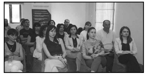
პირების ღია შრომის ბაზარზე გააქტიურებისათვის საჭირო ღონისძიებებზე. სააგენტოს ინიციატივით, საინფორმაციო შეხვედრები ქვეყნის ყველა რეგიონში მუდმივად იმართება.

პროაქტიული წესით, ფარმაცევტული პროდუქტის რეგისტრაცია მედიკამენტების იმპორტს კიდევ უფრო ამარტივებს და საქართველოს ბაზარზე, ფარმაცევტული პროდუქტის ფართო ასორტიმენტის არსებობას უზრუნველყოფს.