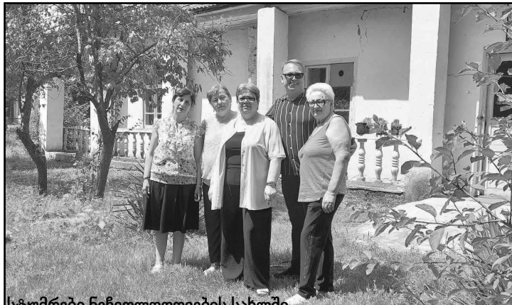
სტუმრები ნეჩოლოდოვების სახლში