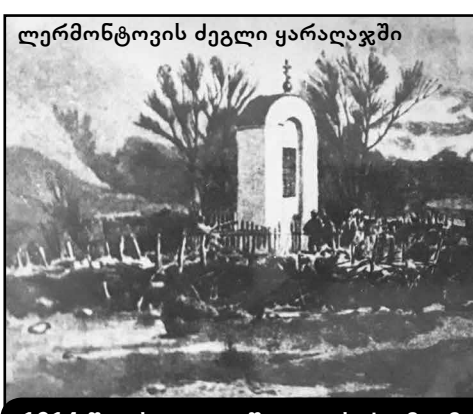
ღერმონტოვის ძეგლი ყარაღაჯში

1803 წელს რუსმა გენერალმა ვასილ გულიაკოვმა საქართველოს სამხრეთ-აღმოსავლეთით დაარსა პირველი სამხედრო ციხე-სიმაგრე „ცარსკიე კოლოდეცი“ (დედოფლის წყარო), რომელმაც ბოლო მოუღო მტერთა თარეშს კახეთში. დროთა განმავლობაში სიმაგრის მიდამოები რუსულ დასახლებულ ადგილებად იქცა. პირველი მსოფლიო ომის დაწყებამდე, 1914 წლამდე, სისტემატურად იდგნენ პოლკები. დრაგუნთა პოლკს ორი რუსული სიმაგრე ეკავა: ყარაღაჯსა და დედოფლის წყაროში. რუსულმა დასახლებამ, რომლებიც მშვიდობიანად ცხოვრობდნენ ქიზიყელებთან ერთად, მთელი ისტორიის მანძილზე შემოინახა ენა, კულტურა და რელიგია. თუმცა, დედოფლისწუარო მაშინ ისტორიაში შევიდა არა იმდენად სტრატეგიული მნიშვნელობით, არამედ იმით, რომ აქ ასახლებდნენ რუსეთის პროგრესულად მოაზროვნე ადამიანებს. დედოფლის წყაროს ისტორიასთან დაკავშირებულია პუშკინის, ღერმონტოვის, დიუმას, ვივალდის და სხვა გამოჩენილ პირთა ცხოვრების ფურცლები.