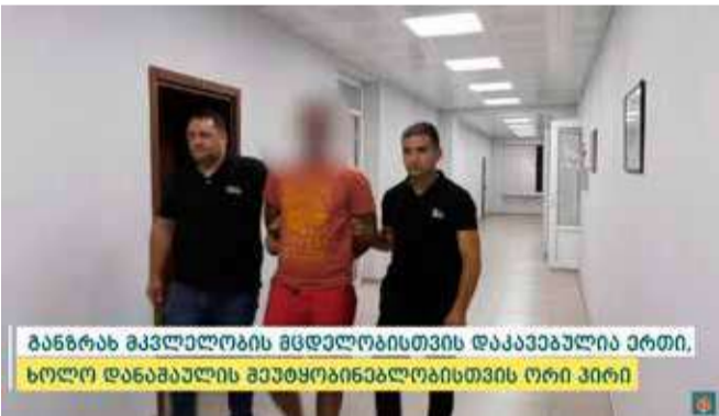
განზრახ მკვლელობის მსჯელობისთვის დაკავებულია ერთი პირი. ხოლო დანაშაულის ვაჟთყობილობისთვის ორი პირი