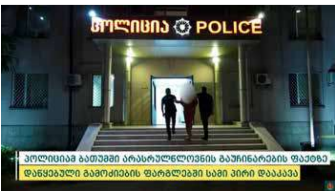
პოლიციამ ბათუმში არასრულწლოვნის გაუჩინარების ფაქტზე დაწყებული გამოძიების ფარგლებში სამი პირი დააკავა

მომხდარ ფაქტზე გამოძიება საქართველოს სისხლის სამართლის კოდექსის 19-109-ე და 376-ე მუხლებით მიმდინარეობს.