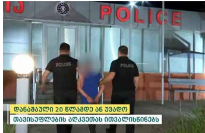
დანაშაული 20 წლამდე ან უვადო თავისუფლების აღკვეთას ითვალისწინებს

ოჯახის წევრის მიმართ ჩადენილ განზრახ მკვლელობის ფაქტზე გამოძიება საქართველოს სისხლის სამართლის კოდექსის 11 პრიმა 109-ე მუხლით მიმდინარეობს.