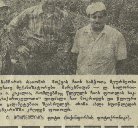
სარტყა: ინჟინერების რაიონის მუქის ჩაის ხაზითა მუერნობა...