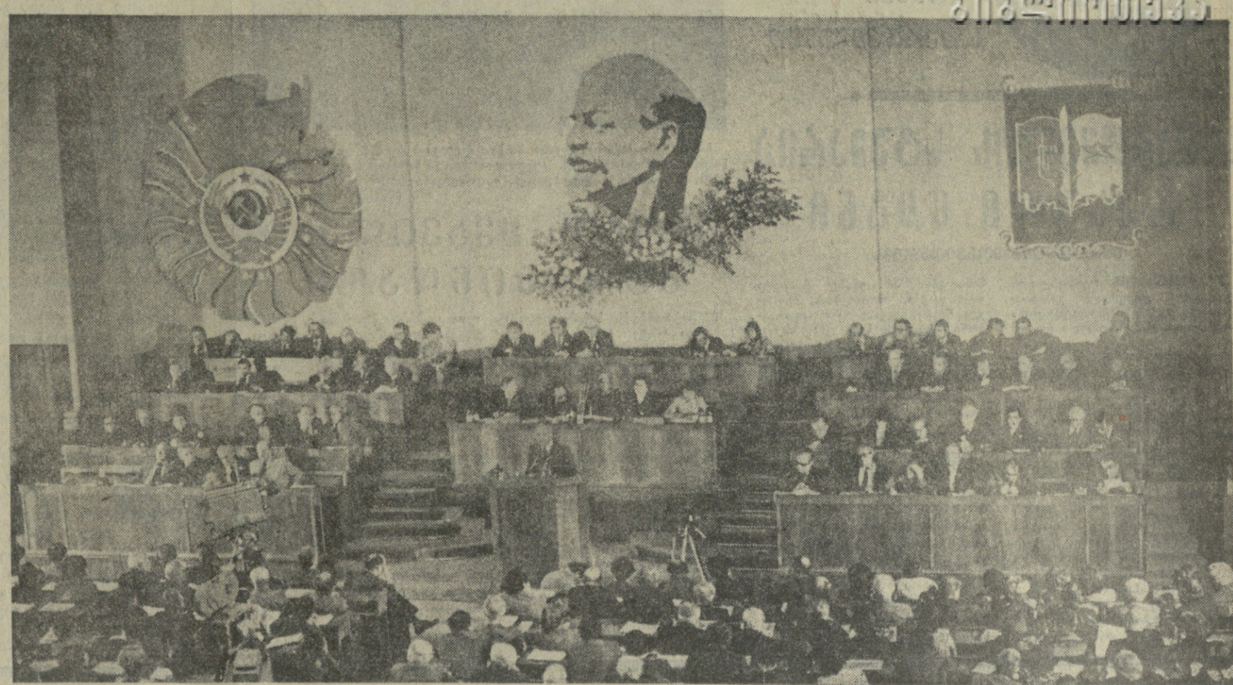
სურათი: საბჭოთა ოჯახივილოვის გრძობით პართ კლინიკი