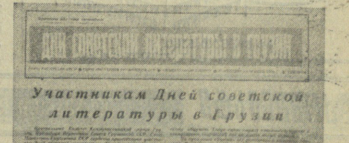
Участники Дней советской литературы в Грузии