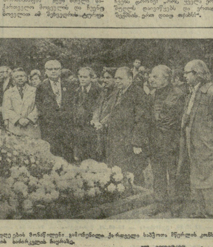
სურათი: ლიტერატურის დღეების მონაწილენი...