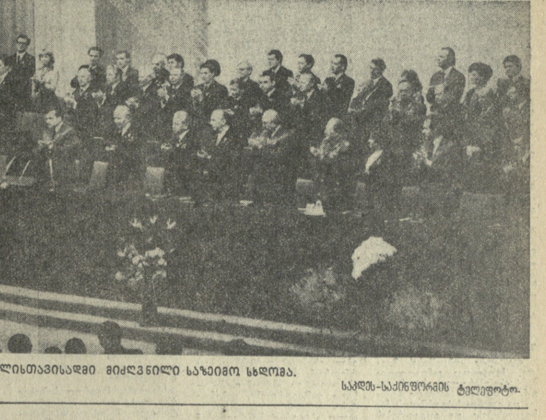
სრულიად საკავშირო ალკ მ-60 წლისთავისადმი მიძღვნილი საზიარო სლოგანის გამოცემა

სრულიად საკავშირო ალკ მ-60 წლისთავისადმი მიძღვნილი საზიარო სლოგანის გამოცემა. სრულიად საკავშირო ალკ მ-60 წლისთავისადმი მიძღვნილი საზიარო სლოგანის გამოცემა. სრულიად საკავშირო ალკ მ-60 წლისთავისადმი მიძღვნილი საზიარო სლოგანის გამოცემა.