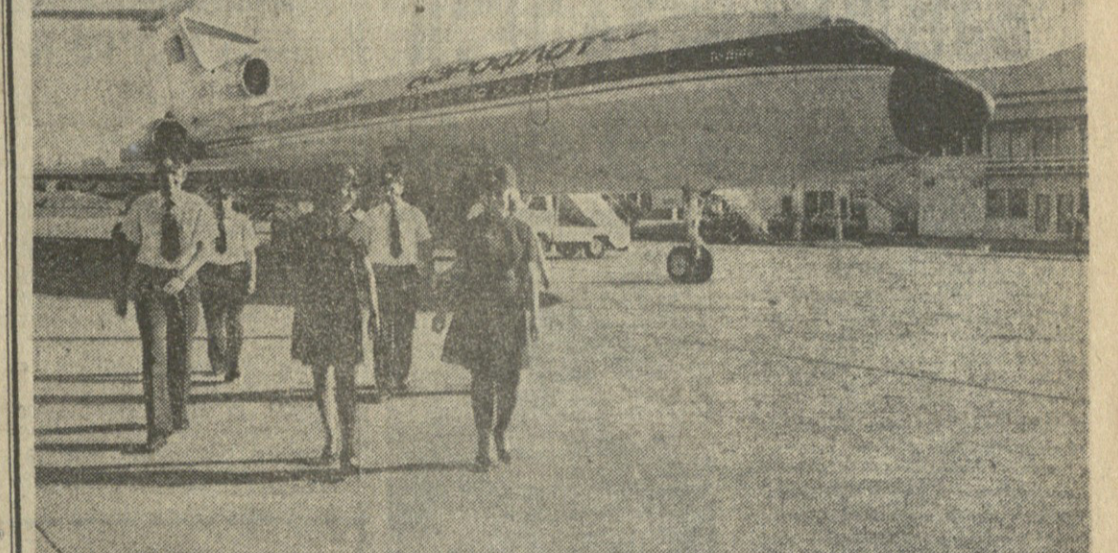
საბრუნებელი განცხადების განხილვის დროს...