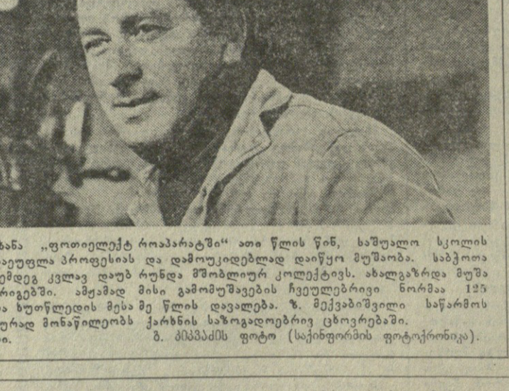
პარტიული ცხოვრების შედეგად

პარტიული ცხოვრების შედეგად... (Continuation of political analysis and reports)