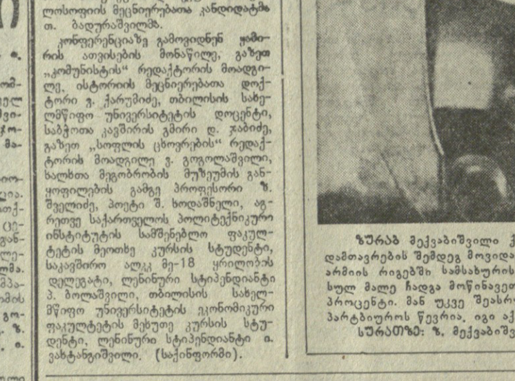
პარტიული ცხოვრების შედეგად

პარტიული ცხოვრების შედეგად... (Further details on party activities and organizational developments)