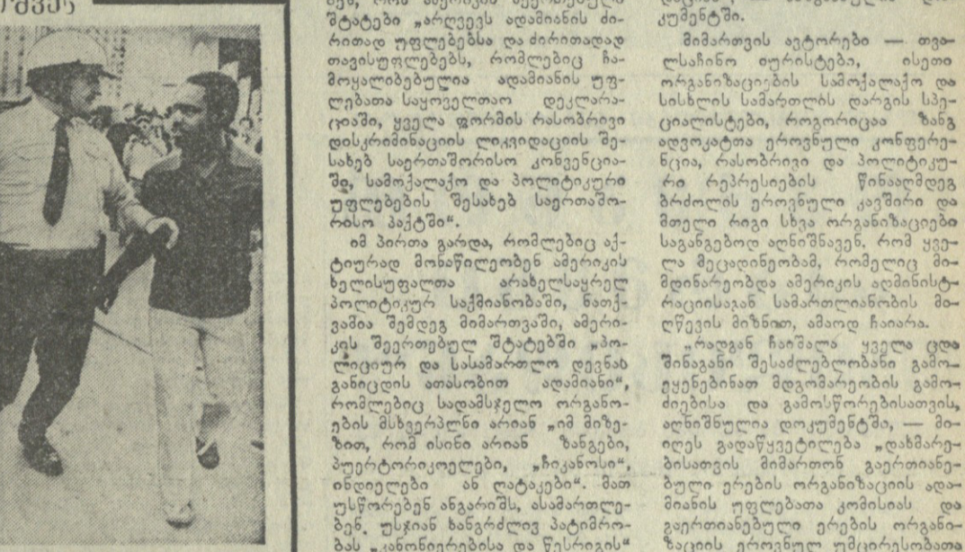
სამხარეთის მემორანდუმი... ახალი მემორანდუმი... ახალი მემორანდუმი...