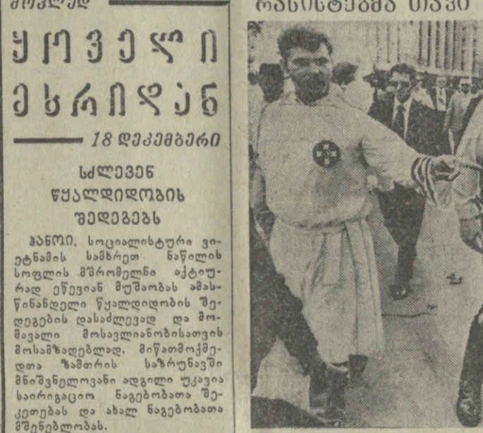
აბრამიძის მემორანდუმი... ახალი მემორანდუმი... ახალი მემორანდუმი...