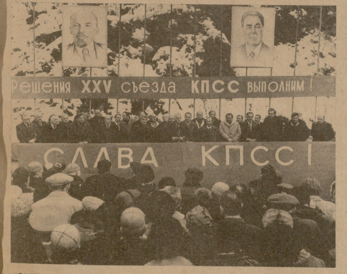
სურათზე: ენგურების მესამე აგრეგატის გაშენებისა და ხულონების მშენებლობის დაწყებისადმი მიძღვნილი მიტინგი.

სკკ ცენტრალური კომიტეტი სსრ კავშირის უმაღლესი საბჭოს პრეზიდიუმი სსრ კავშირის მინისტრთა საბჭო