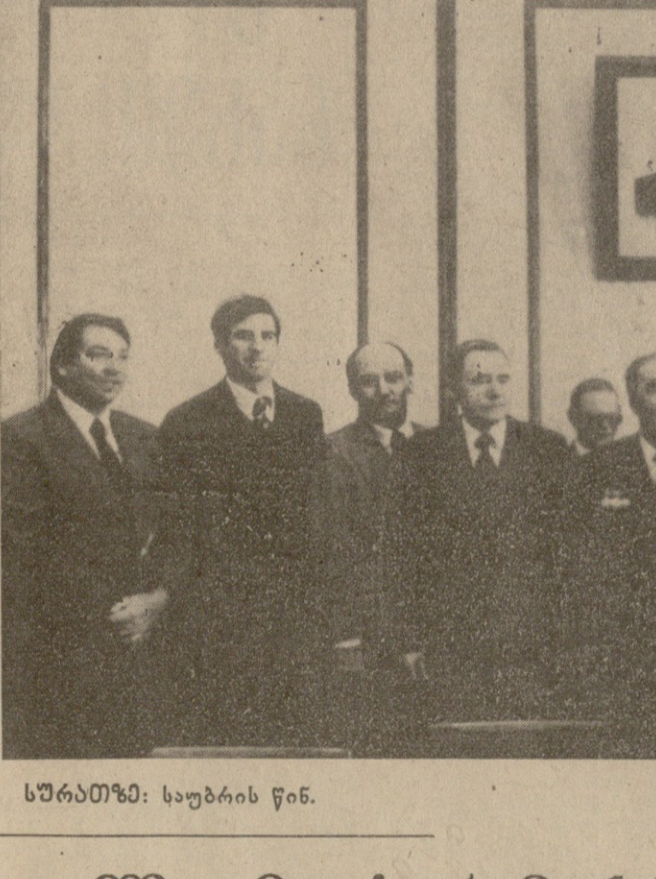
სსრ კავშირის უმაღლესი საბჭოს პრეზიდიუმის წევრები