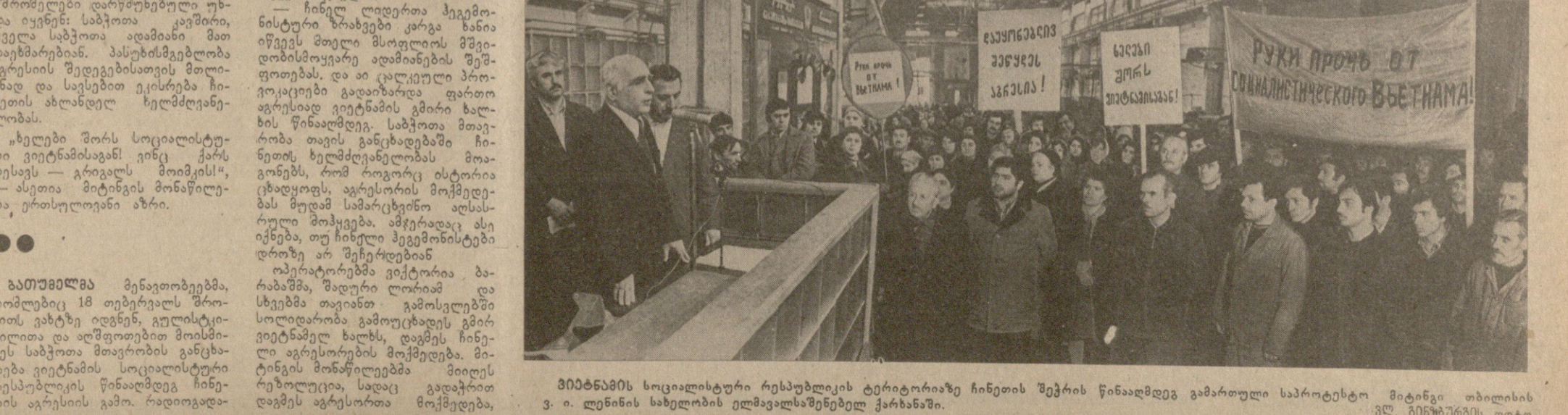
მიმართვის სოციალისტური რესპუბლიკის ტერიტორიაზე ჩინეთის შვილის წინააღმდეგ გამართული საპროტესტო მიტინგი...