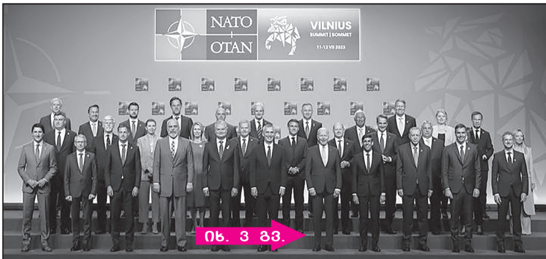
იხ. 3 ბბ.