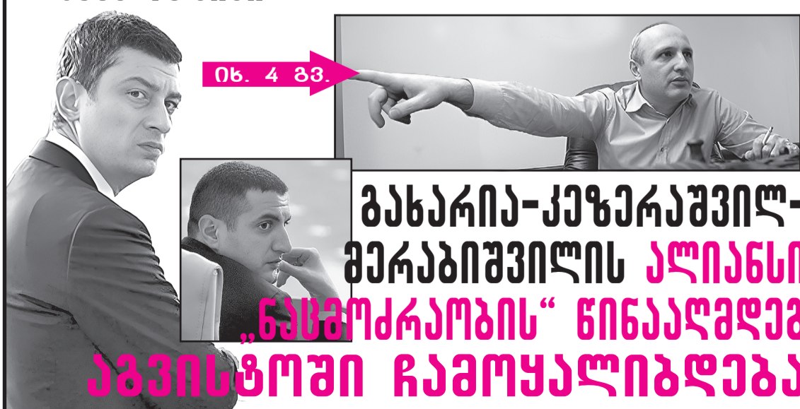
იხ. 4 ბბ.

გახარია-ქეზერაზვილ- მერაბიზვილის ალიანსი „ნაშროკრობის“ ნინააღდებ აგვისტოში ჩამოყალიბდება