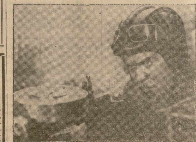
Из советской картины «Красные танки». Эта картина идет в Ирвинг Плейс театре, на Ирвинг Плейс около 15 улицы.