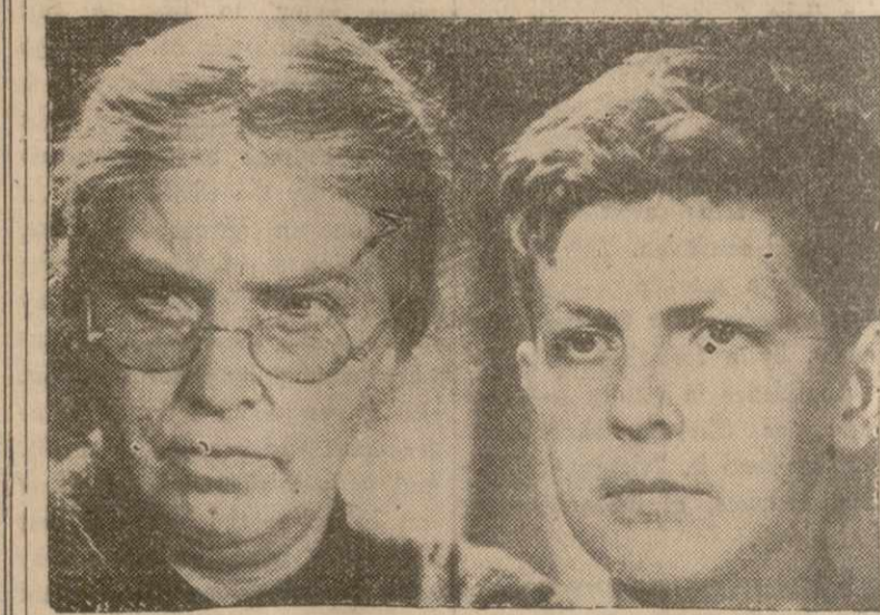
Из новой антифашистской военной советской картины «Вот-враг!». Эта картина идет теперь в Стэнли театре, на Седьмом авеню, между 41 и 42 улицами.