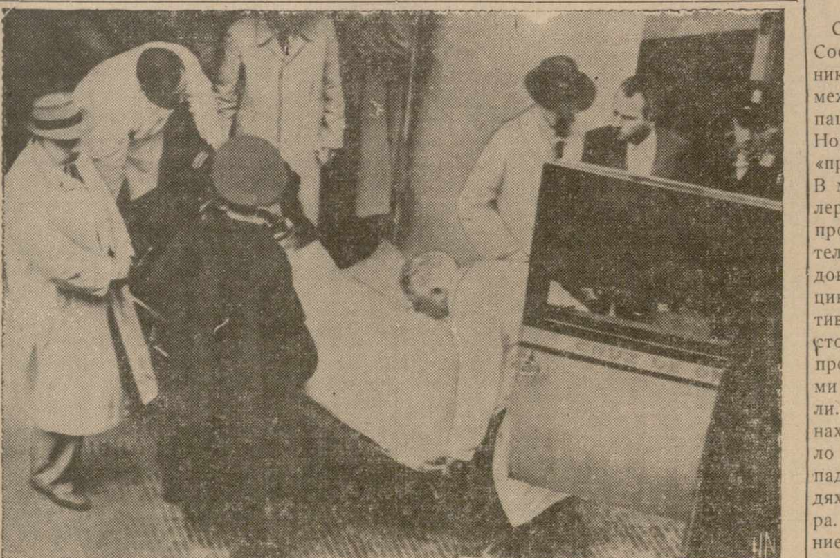
Известный американский писатель и лектор ВАЛДО ФРАНК подвергся хулиганскому насилию гитлеровцев в Аргентине. — На снимке показано, как избитого писателя отправляют в госпиталь. — Начальник аргентинской полиции лично извинился перед писателем.

СТОКГОЛЬМ. (ОНА). — Сообщают о тренингах в последние между германскими пационными властями Норвегии и изменением «премьером» Квислинг. В меморандуме на Квислингера, Квислинг, будучи протестует против тельства германского дования в его компетенцию и, в особенности, тельства освобождения производенного германскими властями противниками. В числе освобожденных находится, будто бы, ло священников, репрессивших в своих рядах на изменника — ра. Германское командование оправдывает свое шательство необходимостью «нормализовать» положение в Норвегии, опасности союзного влияния.