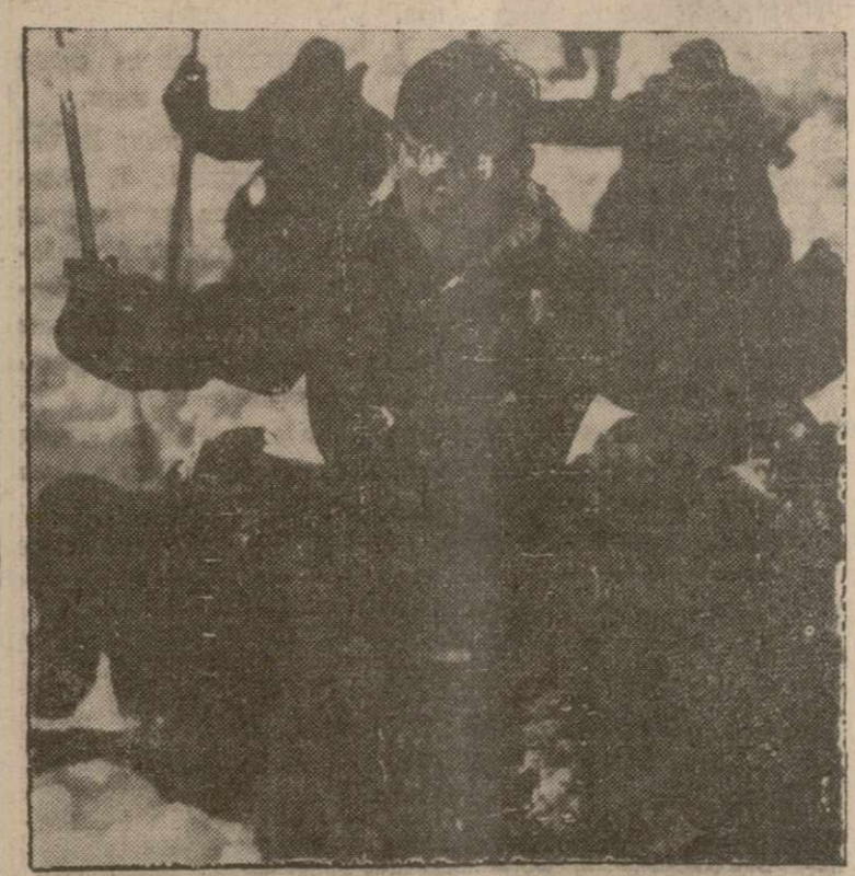
ИЗ СОВЕТСКОЙ драматической и исторической натрины «Битва за Сибирь». Этот фильм идет последние пять дней в Стэнли театре, на Седьмом авеню, между 41 и 42 улицами.