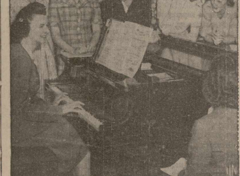
ПЕРВАЯ ГРУППА ЖЕНЩИН, поступающих в Военно-Морскую школу Смит колледжа, в Нортхэмптоне, шт. Масс., в связи с созданием женской военно-морской службы. («Уэйс»).