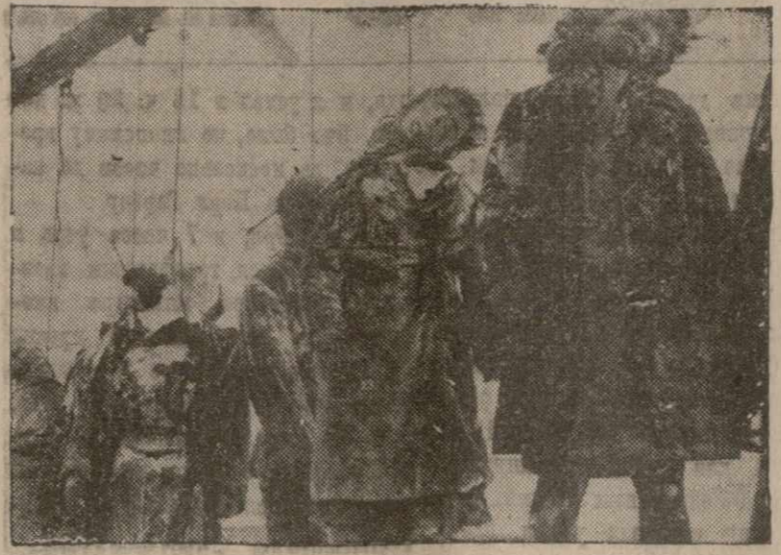
СЦЕНА из советской документальной картины «Разгром немцев под Москвой» идет четвертую неделю в Глоб театре на Бродвее около 46-ой улицы.