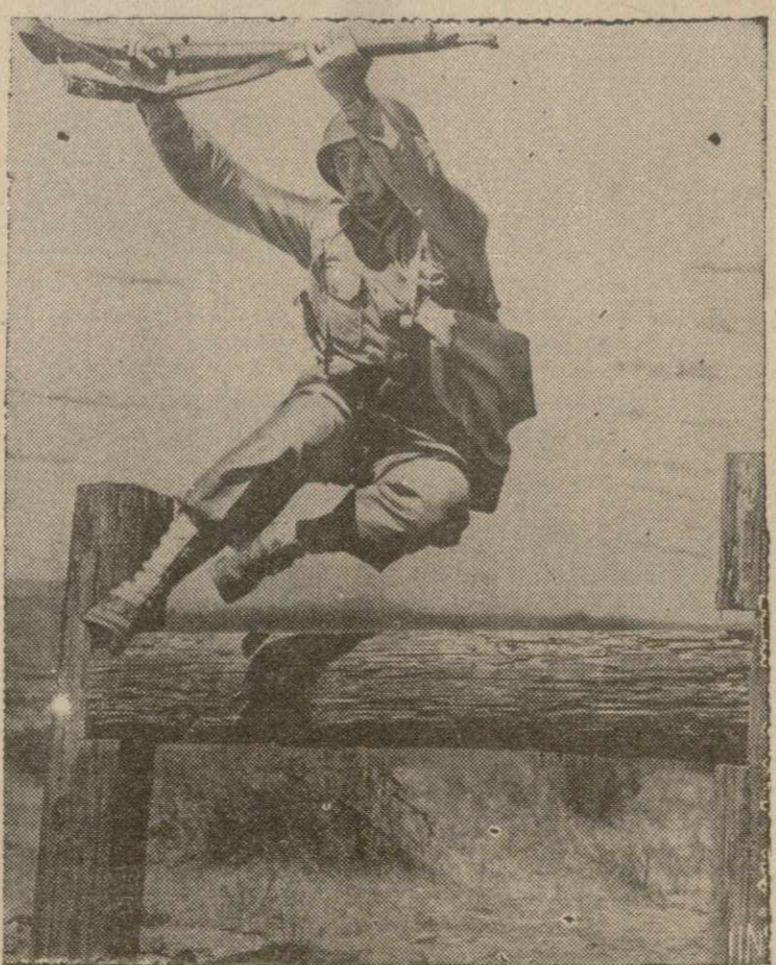
СОЛДАТ С ПОЛНЫМ СНАРЯЖЕНИЕМ преодолевает препятствие во время учений войск в горах Южной Калифорнии. Дивизия, к которой принадлежит этот солдат, тренируется в условиях, сходных с военными.