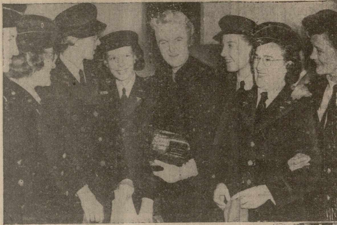
Миссис Уинстон Черчилль, жена премьер-министра Англии (в центре), с группой медицинских сестер армии США в связи с открытием клуба для американских сестер в Лондоне.

Теперь перейдем к тому, какую же роль играет история Тевтонского ордена в той архаичной науке, которая официально призна-