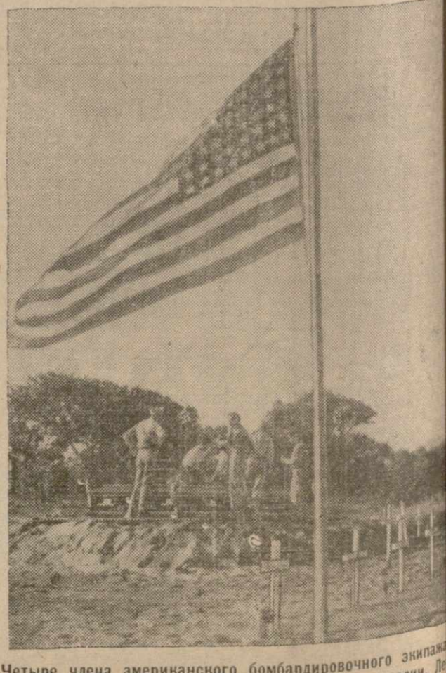
Четыре члена американского бомбардировочного экипажа на земле на кладбище американских героев в Австралии. Двое погибли в бою с японской авиацией.