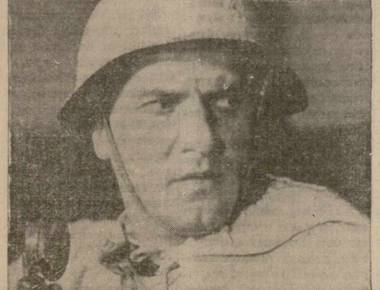
Герой советской новой художественной картины «В тылу у врага». Эта картина идет теперь в Стэнли театре; на Седьмом Авеню, между 41 и 42 ул.