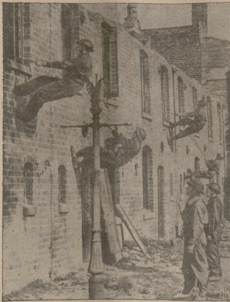
Учения войск внутренней охраны в Бирмингеме, Англии. Главное познание этих войск — отражение захватчиков.