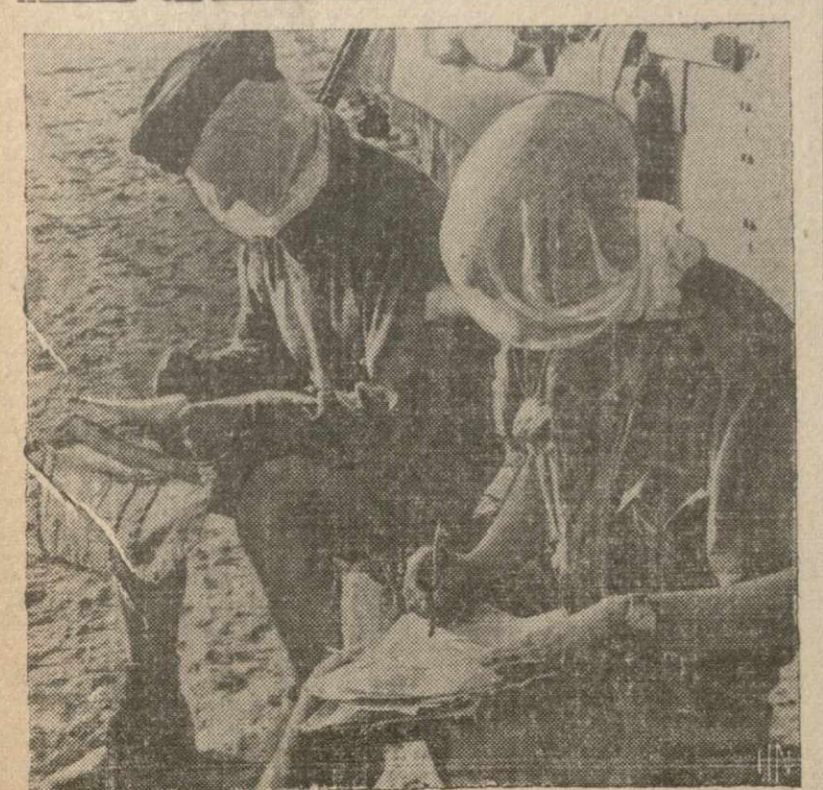
Британские танкисты в Египте несут сетки для защиты от комаров.

Касаясь вопроса о Франции, Шлейхер заявил, что ее роль должна свестись к поставке специализированной рабочей силы на германские заводы.