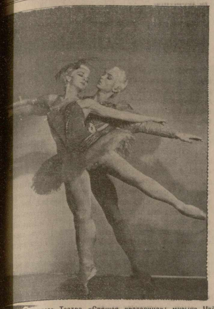
Балетного Театра «Спящая красавица»; музыка Чайковского. Сезон Балетного Театра открылся в Метрополитан Опера

чен для производства 12 легких пулеметов 45 калибра. Шесть больших мусорных жестинок дадут один прибор-указатель для зенитного орудия; из 17 старых радиаторов выделывается одна 75 мм. танковая пушка, а из одного ведра — три штыка. Один медный котелок содержит достаточно меди для выделки 84 ружейных патронов. Одна старая электрическая батарея дает достаточно свинца, необходимого для трех трехдюймовых зенитных орудий. Количество алюминия в одной машине для стирки достаточно для выделки 21 четырехфунтовых зажигательных бомб. Один пылесос дает достаточно алюминия для семи пулеметов .50 калибра. И алюминий из 7,700 кастрюль и сковород достаточно для постройки целого самолета для преследования. Вот почему утилизация лома так важна. Помножьте указанные цифры на тысячи и вы увидите, что металлический лом в нашей стране представляет собою величайший нетронутый запас сырья во всем мире.