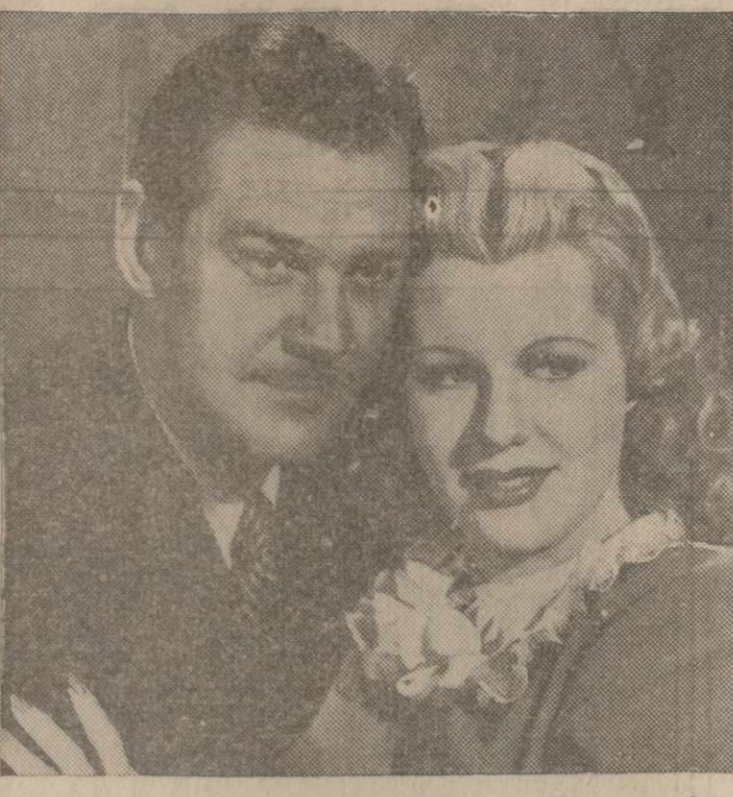
Сцена из антифашистской картины «Дьявол с Гитлером». Завтра премьера в Глоб театре, на Бродвее около 46 улицы.

В прошлую мировую войну упадок сельского хозяйства был в значительной мере предопределен слабостью его технической базы. Потребность сельского хозяйства в инвентаре удовлетворялась тогда не более чем на 8