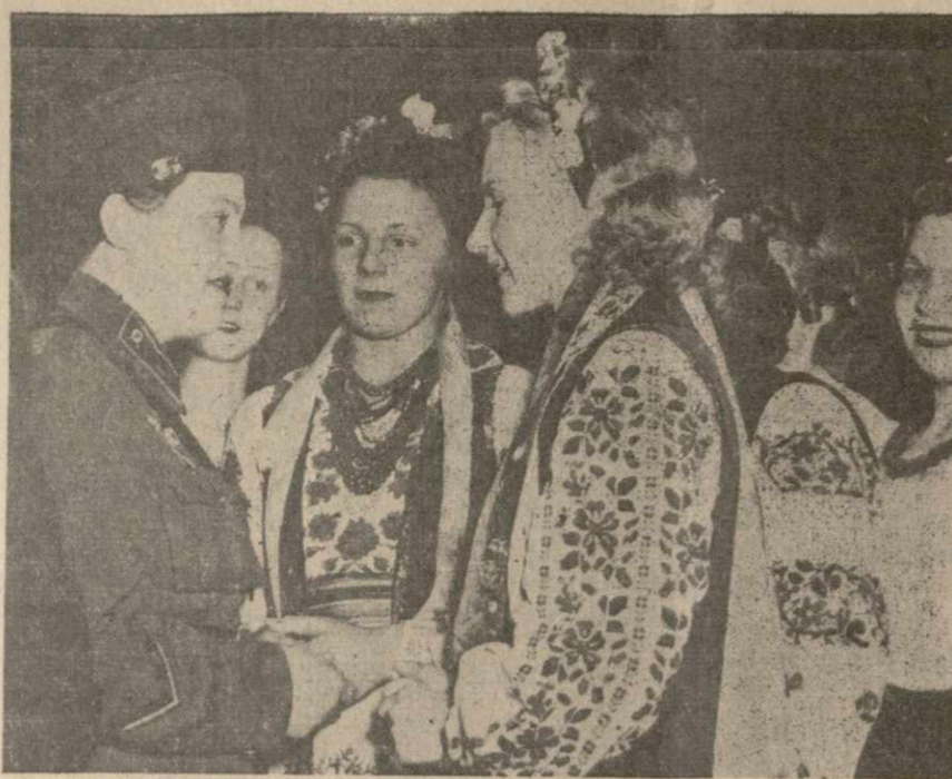
CHICAGO GIRLS, dressed in Soviet and Ukrainian costume greet the girl who killed 309 nazis, during her midwest tour of the nation.

Tickets for the Russian War Relief rally can be obtained at the offices of the Youth Division of Russian War Relief, 11 E. 35th Street. Ticket prices are 25 cents, 55 cents and $1.10.