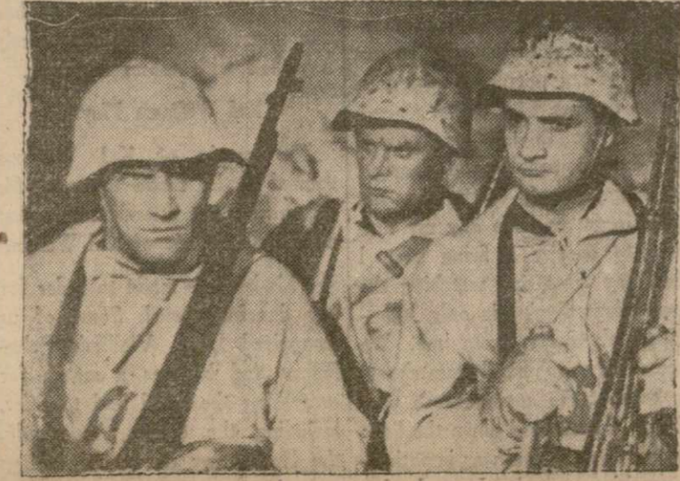
Из советской художественной картины «В тылу у врага». Этот фильм идет в Стэнли театре, на Седьмом Авеню, между 41 и 42 ул.

КОЛЛЕКЦИОННЫМИ ПЕСЕН «SONGS OF NEW RUSSIA» РУССКОМ и АНГЛИЙСКОМ ЯЗЫКАХ. Значительно расширенное издание. Песни для голоса и фортепиано (русский и английский) текст под нотами. Знаете советские песни: «Если война», «Песня о родной земле», «Песня о родной земле», «Песня о родной земле», «Серенада на гармонике» и другие. Песни В. Лебедева - Буцаева и друг. Английский перевод ПИНСКОГО и ОЛЬГИ ПОЛЬ. Иллюстрация в красках. КОЛЛЕКЦИОННОЕ ИЗДАНИЕ. ЦЕНА — $1.00 Направляйте заказы в: RUSSKY GOLOS 130 East 16th St., N. Y.