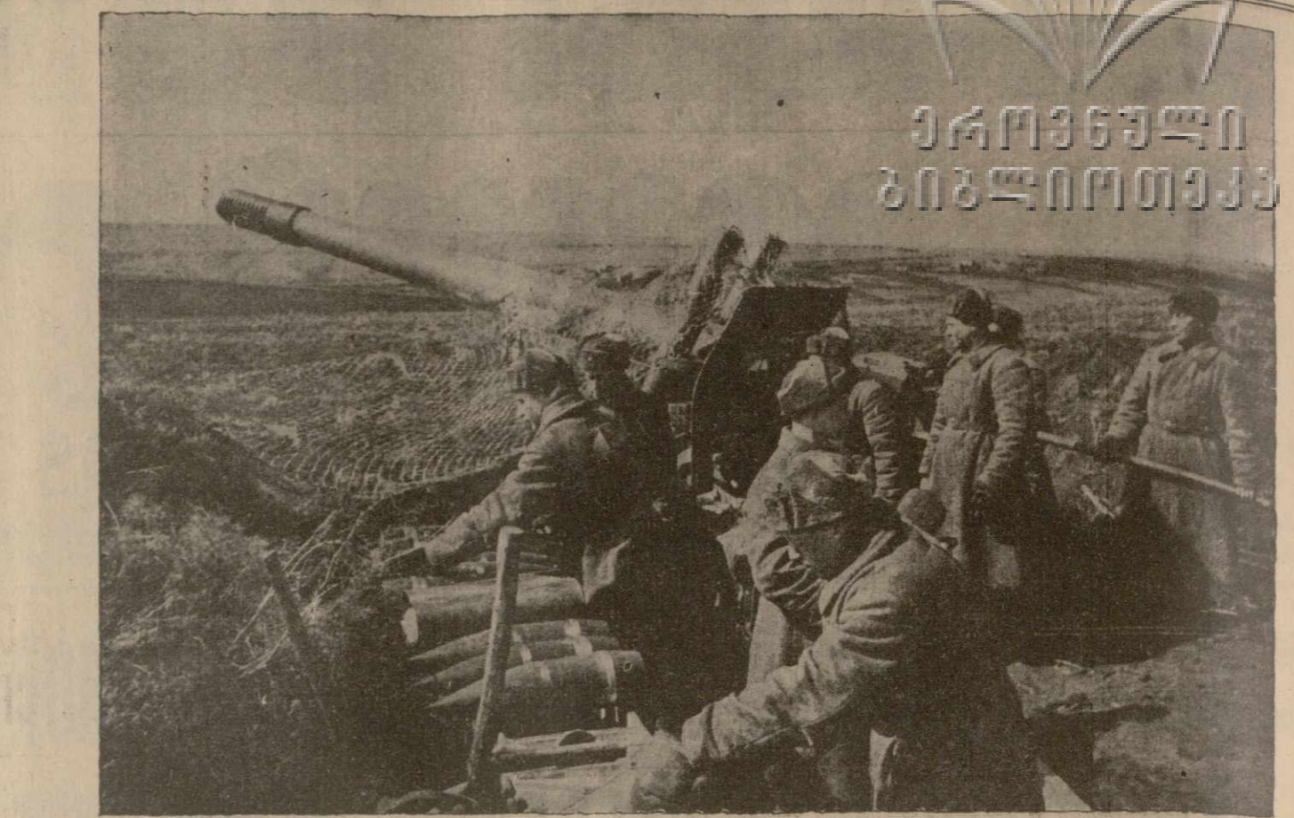
Советские артиллеристы на Южном фронте.

зации. Католическое противодействие немецким мерам оказалось столь серьезным, что наци организовали серию радио-передач с целью опровержения заявлений представителей католической церкви и общины. Немецкий спикер, в радио-передаче Хильверсумской станции, перечислил ряд доводов против национал-социализма, приведенных в анонимном письме на имя спикера. На цитат, приведенных немецким спикером, отвечает, что ка-