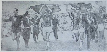
ბრაზილიელმა ფეხბურთელებმა საყოველთაო სიმპათია მოიპოვეს არა მარტო შესანიშნავი თამაშით, არამედ თავაზიანი, უადრესად კორექტული საქციელითაც. ფინალური მატჩის მოგების შემდეგ მათ შვედის ეროვნული დროშით ხელში შემოიჭრბინეს გარს ტრიბუნებს.

ეს იყო ლირსეული ჩემპიონის მიერ მოგებული ფინალი. ბრაზილიელებს გულწრფელად მიესალმნენ შვედი ფეხბურთელები და მეფე გუსტავ ადოლფი. დაფდაფები გამაყრუებლად უკრავდნენ, მინდორზე ზღვად ღელავდნენ ფოტო და კინოკორესპონდენტები და მათს შორის თითქოს ცურავდნენ სიხარულით გაოგნებული ბრაზილიელები. ისინი ეხვეოდნენ ერთმანეთს, კოცნიდნენ და... ტიროდნენ. დიახ, დიახ, მარცხენა გარემარბი ზაგალო, მეკარე ეილმარი და ქაბუკი პელე სახალხო ტიროდნენ.