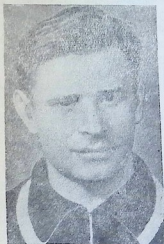
ლევ იაშინი. საბჭოთა ნაკრების შესანიშნავი მეკარე.

ამჟამად საბჭოთა კავშირის გუნდი სამართლიანად ითვლება ერთ-ერთ უძლიერეს გუნდად მსოფლიოში. ჩვენი ქვეყნის საკლუბო გუნდებს უამრავი საერთაშორისო მატჩი აქვთ მოგებული როგორც საკუთარ, ისე მოწინააღმდეგეთა მინდვრებზე (ინგლისი, ბრაზილია, იტალია, საფრანგეთი, უნგრეთი, ჩეხოსლოვაკია, შვეცია, ავსტრია და ა. შ.), ხოლო სსრ კავშირის ნაკრებ გუნდს დამარცხებული ჰყავს მთელი რიგი უძლიერესი ეროვნული ნაკრები გუნდები.