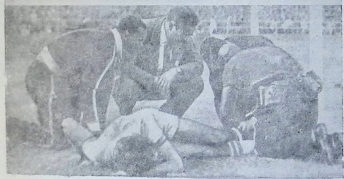
ასე გაათავიანდნენ ბრაზილიელი ფეხბურთელები თავიანთ სიხარულს ყოველი გატანილი ბურთის შემდეგ. გოლის ავტორს ექსტაზში შესული პარტნიორები ეხვეოდნენ, კოცნიდნენ და ყველაფერი ეს ხშირად ისეთ „მზურვალე“ ფორმებში ხდებოდა, რომ საკმე ექიმის უშუალო ჩარევამდე მიდიოდა. აი, ახლაც, ვაგამ გაიტანა გოლი და მისი მეგობრების სერგეივი მილოცვის შემდეგ რანდენიხე წუთით ექიმის განკარგულებაში გადავიდა.