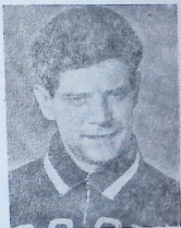
საბჭოთა გუნდის ნაბევარმცველი იური ვოინოვი. იგი სპეციალისტთა მიერ შეფასებულ იქნა ე. წ. „ჩვენი პლანეტის“ ნაკრებში.