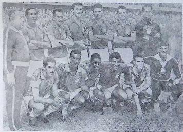
1958 წლის მსოფლიო ჩემპიონი ფეხბურთის — ბრაზილიის ნაკრები გუნდი.

„ოქროს ქალღმერთი — ფეხბურთის ღმერთებს“ — ასეთი ლაკონიური, მაგრამ მოსწრებული სიტყვებით აღინიშნა მეორე დღე ერთ-ერთ გაზეთში ბრაზილიელ ფეხბურთელთა ბრწყინვალე გამარჯვება.