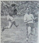
საბჭოთა გუნდის თავდამსხმელი ვალენტინ ივანოვი თამაშის დროს.

შესახებ, თუ სად და როდის უნდა ჩატარებულიყო მატჩი. კანდიდატებად წამოყენებული იყო ოთხი ქალაქი: სტოკჰოლმი, ბელგრადი, ლაიპციგი და სოფია. არჩევანი საბოლოოდ შეჩერდა ლაიპციგზე, სადაც მთავარი სტადიონი 110 ათას კაცს იტევს.