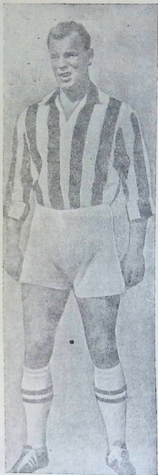
უელსის ეროვნული ნაკრების ძირითადი იმედი მსოფლიო პირველობის გამაშვებაში — გიგანტი ჯონ ჩარლზი, ბრიტანელთა საუკეთესო ცენტრალური თავდასხმელი.

ტომ უელსის ნაკრები (ისევე როგორც შოტლანდიისა და ჩრდილოანდიის გუნდები) ფაქტიურად ინგლისის ნაკრების ერთ-ერთ ვარიანტს წარმოადგენს.