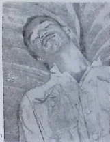
დიდი ისვენებს. წინაა მძიმე, დაბნეული მატჩი. საჭიროა სიმშვიდე, ნერვების დაწყნარება.

დიდის განსაკუთრებით უყვარს ბურთის გადაცემა მარჯვენა ფრთაზე, გარინჩასაკენ. ეს უკანასკნელი კი ნამდვილი ფენომენია. თუ გარინჩამ ბურთი მიიღო, ძნელად რომ მცველმა მოახერხოს მისი წართმევა.