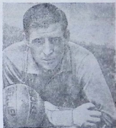
რაიმონ კოპა — საფრანგეთის ნაკრების კომბინაციათა მთავარი ორგანიზატორი და სულისჩამდგმელი.

მართალია, აქა-იქ გაისმოდა ხმები, თითქოს „გაესპანელებული ფრანგი“ ველარ აეწყობოდა თა- ვის ძველ მეგობრებს „რემისის“ გუნდიდან, რომლებიც ეროვნული ნაკრების ძირითად ბირთვს წარ- მოადგენდნენ. ეს შიში უსაფუძვლო გამოდგა. სწორედ რ. კოპამ მო- იტანა გუნდში ის, რაც საჭირო იყო: შეთამაშება, კოლექტიურო- ბა, ზუსტი ურთიერთმოქმედება და მოწინააღმდეგის კართან შექ- მნილ შესაძლებლობათა გამოყე- ნება.