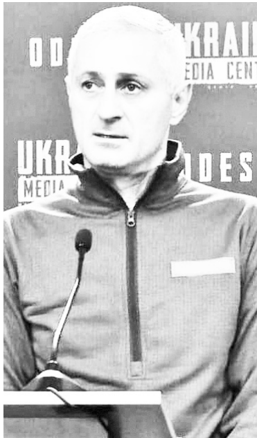
ნომიკური სანქციები? გარდა ამისა, ჩვენ ვალდებული ვართ გვაქვს, რომ გავხედოთ ევროკავშირის წევრი, ამისთვის მნიშვნელოვანია, მოთხოვნები, რომლებსაც ევროკავშირი საქართველოს უყენებს, ეტაპობრივად შესრულდეს. ალბათ, აკვირდებით, რომ მმართველ პარტიას რომელიც სჭირდება, იმ საკანონმდებლო ცვლილებებს ელვის სიწრაფით ახორციელებს, ხოლო თუ ქართველ ხალხს სჭირდება, მაშინ ჰიანურდება. საუბარია 12 ევროპული რეკომენდაციის შესრულებაზე.

მმართველი პარტია ქვეყნის აღმშენებლობასა და სტაბილურობის შენარჩუნებაზე ამხვილებს ყურადღებას, ოპოზიციას კი ანტი-სახელმწიფოებრივ ქმედებებში სდებს ბრალს. ოპოზიციური სექტორი ხელისუფლებას საყვედურებს პოლიტიკური გარემოსა და არასახარბიელო ეკონომიკური მდგომარეობის გამო