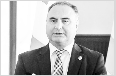
თან არის „თავდაცვის კოდექსის“ პროექტი დაკავშირებული და, ასევე, სამწუხაროდ, „თავდაცვის კოდექსის“ პროექტის დისკრედი-

იტაციის მცდელობები გვქონდა, მაგრამ ფაქტი სახეზეა, რომ ეს მცდელობა მცდელობად დარჩა და ჩვენ აუცილებლად გვექნება კანონი, რომელიც ჩვენი თავდაცვის უნარიანობის გაძლიერებას უზრუნველყოფს. ჩართულობა ძალიან მაღალი იყო, როგორც ქართველი, ასევე უცხოელი ექსპერტების, ჩვენი ნატოელი პარტნიორების, აშშ-ის სპეციალური იურიდიული ჯგუფის, არასამთავრობო სექტორის და, პრაქტიკულად, ფართო კონსენსუსის საფუძველზე შემუშავდა ეს პროექტი“, - განაცხადა გიორგი გორგაძემ.