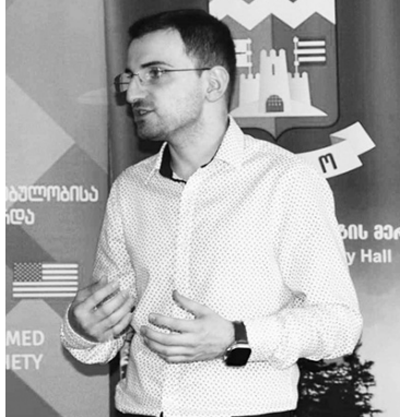
არა ამ გამომგზავნიდან კონკრეტული შინაარსის წერილს, ავთენტუ-

სწორედ საბოლოო მომხმარებლები არიან. შესაბამისად, მათ უნდა ჰქონდეთ უახლესი ინფორმაცია კიბერსივრცეში არსებული საფრთხეების შესახებ, როგორცაა მაგნი პროგრამები, უმთავრესად კი ვირუსი (Virus), ტროიანი (Trojan) და გამომძალველი პროგრამა (Ransomware). ეს პროგრამები მომხმარებელთან ხვდება, უმთავრესად ელექტრონული მედიამატარებლების საშუალებით, ან ფიზიკურად დაზარალებულად, ან ჩასმული მაგნი ბმულის მეშვეობით. შესაბამისად, მომხმარებლები მიღებულ წერილებს გულდა-