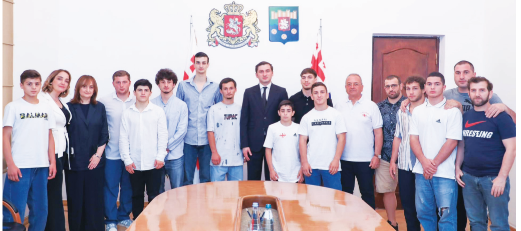
სპორტსმენები, ასევე, მათი მწვრთნელები, აჭარის ავტონომიური რესპუბლიკის ბიუჯეტიდან მნიშვნელოვნად გაზრდილ საპრიზო თანხას წელსვე მიიღებენ. შეხვედრაზე ასევე აღინიშნა, რომ გაგრძელდება სპორტული ინფრასტრუქტურის მშენებლობა და სპორტსმენებისთვის საერთაშორისო სტანდარტების სავარჯიშო სივრცეების მოწყობა. ანბა ჩხიკვაძე

ბოლონეთში მიმდინარე 2023 წლის მესამე ევროპულ თამაშებზე ჩვენმა სპორტსმენებმა მნიშვნელოვანი წარმატებას მიაღწიეს. ბათუმელმა ზურაბ კინწურაშვილმა ოქროს მედალი მოიპოვა ტაეკვანდოში, 74კგ წონით კატეგორიაში. ბერძნულ-რომაული სტილით ჭიდაობაში გივი პაქსაძე ევროპის ჩემპიონი გახდა. ბერძნულ-რომაული სტილით ჭიდაობაში 2023 წლის ევროპის ახალგაზრდულ (U20) ჩემპიონატში აჩიკო ბოლქვაძე მეოთხედ დაეუფლა ევროპის ჩემპიონის ტიტულს. ევროპის ჩემპიონატზე საპრიზო ადგილებზე გასულ და გამარჯვებულ სპორტსმენებს აჭარის მთავრობის თავმჯდომარე თორნიკე რიჟვაძე, განათლების, კულტურისა და სპორტის მინისტრი მაია ხაჩიშვილი და სპორტის დეპარტამენტის ხელმძღვანელი ირმა ნიჟარაძე შეხვდნენ. მათ თითოეულ მათგანს მიღწეული წარმატება მიულოცეს და მადლობა გადაუხადეს აჭარის რეგიონის წარმომჩინებისთვის. თორნიკე რიჟვაძემ ახალგაზრდა სპორტსმენებს მხარდაჭერა აღუთქვა და წარმატებები უსურვა მომავალ ასპარეზობებზე. „გულოცვად ჩვენს სპორტსმენებს 2023 წლის მესამე ევროპულ თამაშებზე მიღწეული წარმატებას. ვამაყობ მათ მიერ ყოველწლიურად გაზრდილი შედეგებითა და არაერთი საერთაშორისო წარმატებით. ჩვენ კვლავ აქტიურად გავაგრძელებთ სპორტის განვითარებას რეგიონში, სპორტსმენების მხარდაჭერას და მათთვის სათანადო პირობების შექმნას. დარწმუნებული ვარ, წინ კიდევ უფრო დიდი გამარჯვებები გველის,“ - აღნიშნა მთავრობის თავმჯდომარემ. აჭარის მთავრობის გადაწყვეტილებით, ევროპის, მსოფლიო და ოლიმპიურ ჩემპიონატებში გამარჯვებული და საპრიზო ადგილებზე გასული