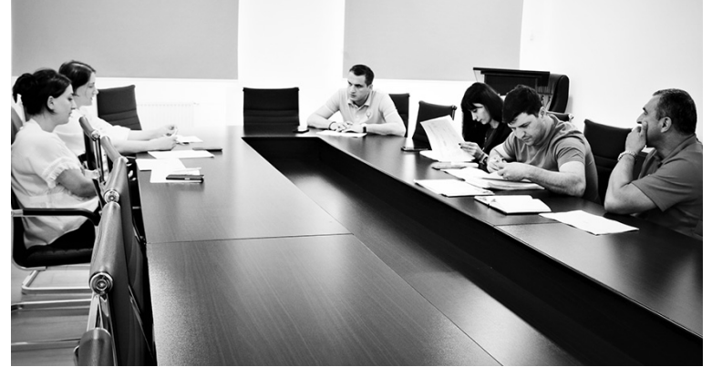
გვერდი მოამზადა ოთარ ცინაიძემ