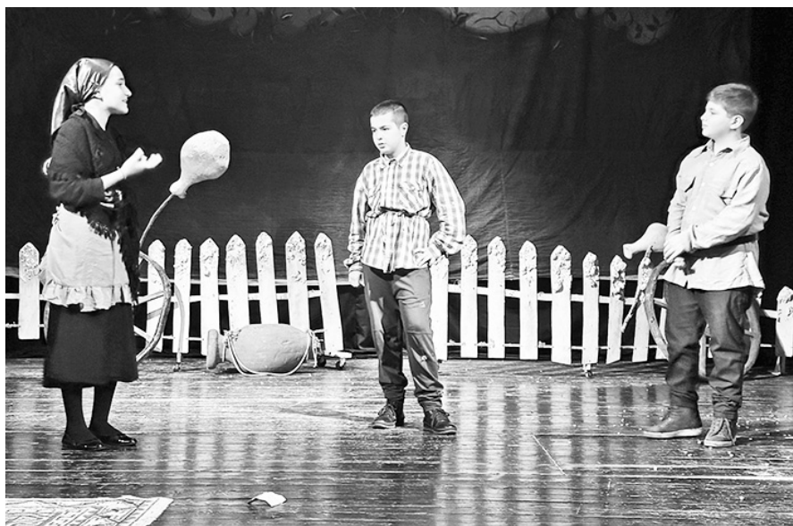
გვერდი მოამზადა ომარ ცინაიძემ

პროექტი მხატვრული, განსაკუთრებით კი ქართული ნაწარმოებების გაცნობას და მომავალ თაობაში ქართული ლიტერატურის სიყვარულის დანერგვას ემსახურება. ა(ა)იპ „მომავლის პალიტრა“ სატელევიზიო პროექტით - „ბატარა ამბები“ რამდენიმე წელია, მოზარდებს შორის როგორც ქართული, ასევე უცხოური საბავშვო-საყმაწვილო ლიტერატურის პოპულარიზაციასა და წიგნის კითხვის უნარების ჩამოყალიბებაზე ზრუნავს. პროექტი განსაკუთრებით ქართული ნაწარმოებების გაცნობას და მომავალ თაობაში ქართული ლიტერატურის სიყვარულის დანერგვას ემსახურება.