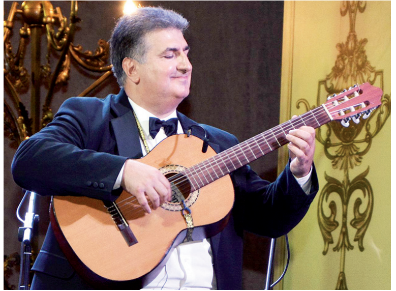
ბად ფოლკლორი რომ ავირჩიე, მისი დამსახურებაცაა“, - აღნიშნა გიამ.

როგორც მან თქვა, მამამ ჩამოაყალიბა არა უბრალოდ მიმდინარეობა, არამედ შექმნა გიტარაზე დაკვრის ისეთი სტილი, რომელიც მანამდე ჩვენთან არ არსებობდა. ბატონმა გიამ ჯერ ბალაშვილების გამორჩეული სტილის ფორმირება გვიჩვენა და შემდეგ დაუკრა კიდეც შესანიშნავად. ჩამოთვალა და გაიხსენა საქართველოსთვის უძვირფასესი ადამიანები, რომლებსაც სწავლობდა ზრდილობას, ურთიერთობას, პროფესიონალიზმს, მაცურებლის მიმართ პატივისცემას, რის გარეშეც ადამიანური ცხოვრება არ არსებობს. სიამაყით აღნიშნა, რომ 20 წლის ბიჭს კორიფეებმა მუსიკალური ხელმძღვანელობა ანდეს. გვიამბო, როგორ დაწერა მამაშვილი (მამამ - მუსიკა, მან - ტექსტი) სიმღერა ბათუმის „დინამოზე“, რომლის მისამღერი გულშემატკივრების - „შავი ზღვის პირატებისთვის“ განკუთვნილი. ამქვეყნიდან წასულ ბევრ ადამიანს, მათ შორის ჰამლეტ გონაშვილსაც მოეფერა, რომელსაც ძალიან ჰყვარებდა თურმე გიტარაზე დაკვრა და ვიასთვის შეუთავაზებია, შენ გიტარაზე დაკვრა მასწავლე, მე კი ისეთ კახურ სიმღერებს გასწავლი, მამაშენს საერთოდ რომ არ გაუგონიაო. „მართლაც მასწავლა და სამეცნიერო საქმიანო-