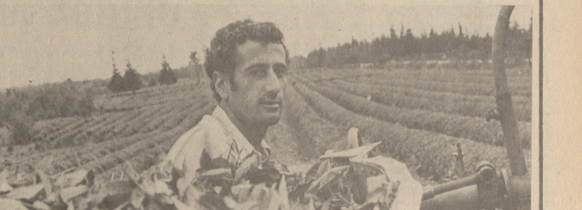
მკიანე პარსი, სოხა...