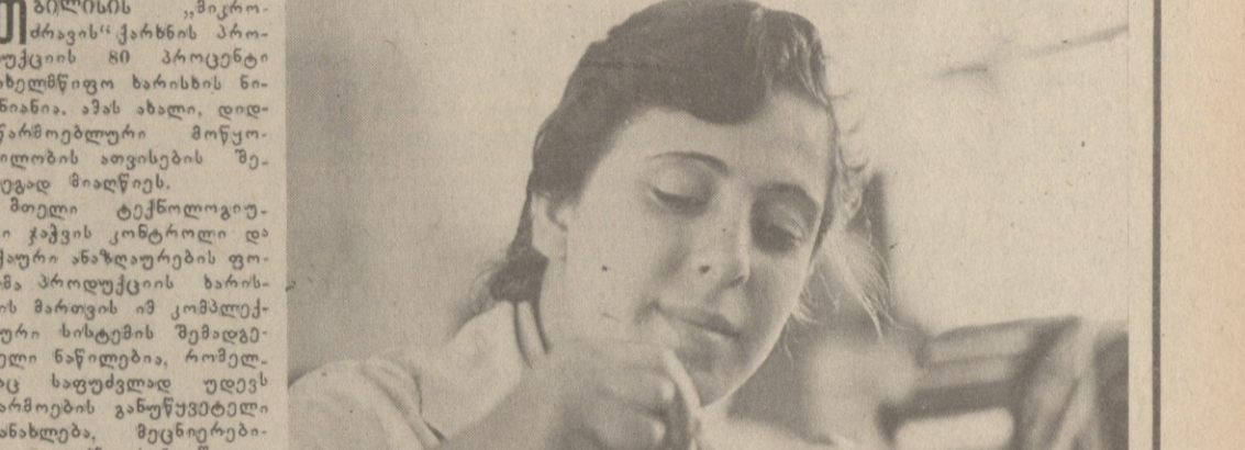
თბილისის მუშაკების მიერ წარმოდგენილი წინადადება...