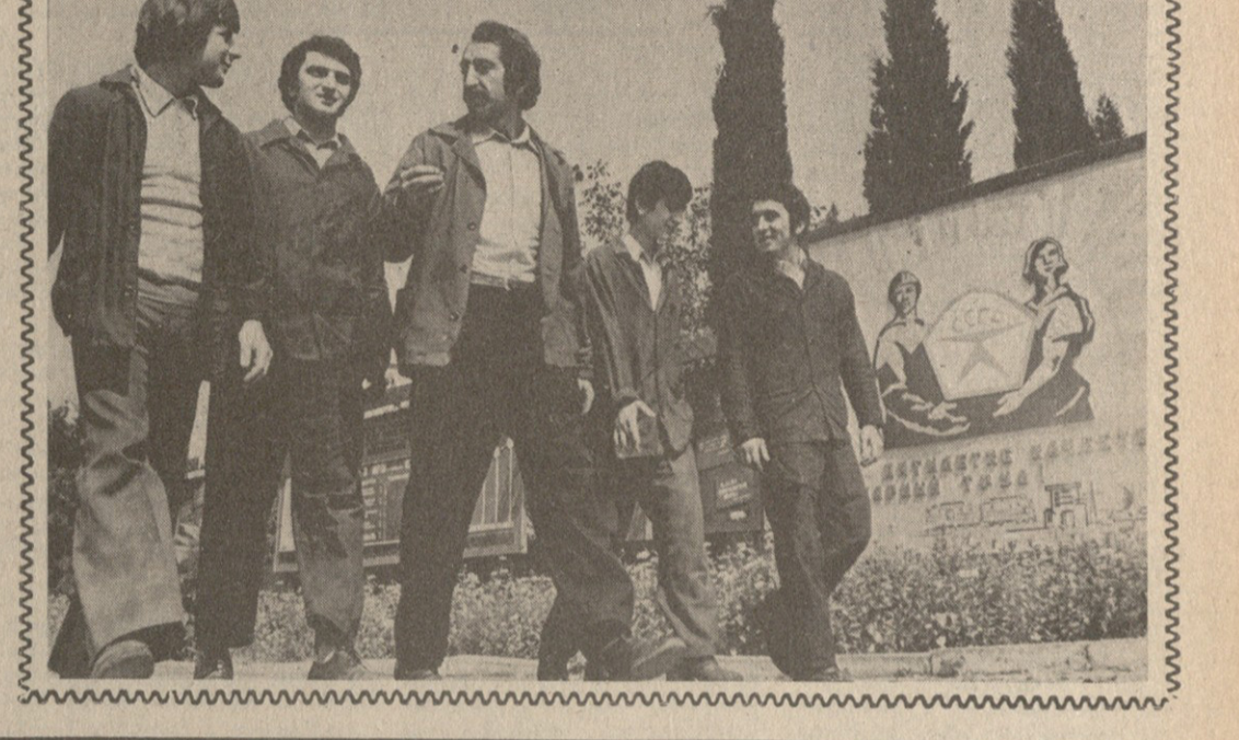
მეზარეულნი დაზაზაშის 700 ცენტრზე მეტი აბრეშუმის პარკი, რაც 40 ცენტრით აღემატება გასული წლის ამავე პერიოდის მაჩვენებელს.

ზაზაშაში მახარაქაში იხალაბა მახარაქის რაიონის მეზარეულნი დაზაზაშის 700 ცენტრზე მეტი აბრეშუმის პარკი, რაც 40 ცენტრით აღემატება გასული წლის ამავე პერიოდის მაჩვენებელს.