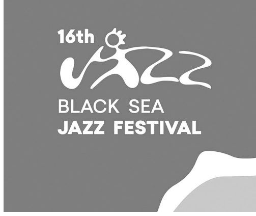
ძირითადი კონცერტების, ისე ღამის after party

წელს განსაკუთრებულად საინტერესო, სახალისო, მრავალფეროვანი პროგრამაა როგორც