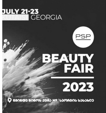
სილამაზის ფესტივალი სლოგანით We are Beauty საქართველოში პირველად PSP-მ ჩატარა. ფესტივალმა მასშტაბით გაიმართა და რიგ შემთხვევებში გაუწევს კიდევ უფრო ახალ მოვლებს, რამაც ჩვენი ქვე-

ბათუმის ფესტივალი გამორჩეული იქნება იმითაც, რომ ადგილზე სრულიად ახალი ბრენდების პროდუქტების პრეზენტაცია გაიმართება.