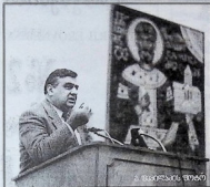
ა. მადრიასი სიტვი

ნობის სტუმარია აკადემიკოსი რ(906 808)რ(3300), თბილისის იანე ჯავახიშვილის სახელობის სახელმწიფო უნივერსიტეტის რექტორი რექტორია სამგოს თავმჯდომარე